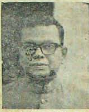
ప్రత్యక్ష రాజకీయాలలో క్రొత్తగా ప్రవేశం!

పట్టణాధికారి పట్టణాధికారి : లిక్విడేషన్లు, జిల్లాలో కలెక్షనుండిన రెండు జిల్లాకాంగ్రెస్ సంఘాలపోరను రాష్ట్రకాంగ్రెస్ అడ్వోకేట్ కమిటీ కిప్పింది. జిల్లాలో కూడా అడ్వోకేట్ సంఘ నియామకం జరగుతుంది. రాష్ట్ర స్థాయిలో కా కా క్కా లి క సంఘం ఏర్పడినప్పుడు, జిల్లాల్లో పాత జిల్లాకాంగ్రెస్ సంఘాలు వుండడం అసంగతం జిల్లాలో కూడా కా కా క్కా లి క సంఘాలే సముచితం. మళ్ళీ ఏర్పడితే ఈ హెడ్ పి క సంఘాల పార్సీ కూడా అనవసరం. ఈ తతంగ మంతటిబదులు అభ్యర్థులను రాష్ట్రవాయి కులో, దేశనాయకులో నేరుగా నామినేట్ చేసివేస్తే దిక్క తీరుతుంది. ఆ దివంగా చేశారేమని ఈనాడు అడిగేవాడు, అదగ గలిగినవాడు ఎవ్వడూలేడు. ఈ డొంక తిరుగుడు వ్యవహారం ఎందుకోవాలి! నెల్లూరు జిల్లాకాంగ్రెస్ అడ్వోకేట్ సంఘం