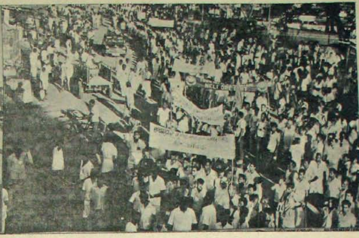
15 తేదీ 'ప్రత్యేకాంధ్ర' బంద్ సందర్భంలో నెల్లూరులో జరిగిన బ్రహ్మాండమైన ఉత్సవ దృశ్యం.