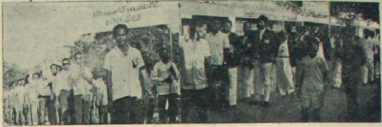
15 తేదీ నెల్లూరుబుద్ విభజనలో ఇంజనీరు, న్యాయవాదులు

పబ్లిక్ ఎంప్లాయిమెంట్ యాక్టు 35 వ సెక్షన్, దానిలోని తేంద్ర ప్రభుత్వము వారి చేసిన ముక్తి నిబంధనలు రాజ్యాంగ చట్టములోని ప్రాథమిక హక్కులకు భంగకరమని, అందువలన యీ నిబంధనలు చెల్లకపోవలసి అంధప్రదేశ్ హైకోర్టులోను, సుప్రీమ్ కోర్టులోను వాదించడము జరిగినది. ఈ విషయములో హైకోర్టు కొన్ని తీర్పులను చెప్పి యున్నది. ముగ్గురు న్యాయమూర్తులతో కూడిన బెంచ్ వలె అంధప్రదేశ్ హైకోర్టులోను, ముక్తి నిబంధనలు చట్టసమ్మతమైనవని తీర్పునిచ్చి యున్నది. తరువాత