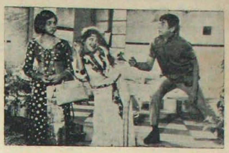
"ఊరికి ఉపకారి"లో ఒక సన్నివేశం - ఆరతి, రాజశ్రీ, చలం.

ఈనెల 12 తేదీ సాయంత్రం 6:30లో ఆరంభమైనప్పటికీ డిస్టర్బ్ ముగిసింది. ఇది ఆర్.ఎస్. మువీస్ 'మల్లమ్మ కథ' పార్టీ ఆర స్పృంచేట్టుగానే ఉంది. ఎందుకంటే దిక్లాన్ని ప్రారంభించగానే ఇంతకాలక 10వ పేజీలో