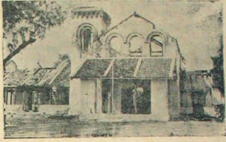
పూర్తిగా దగ్గం గావించబడిన ఒంగోలు కలెక్టరేట్ కట్టడం