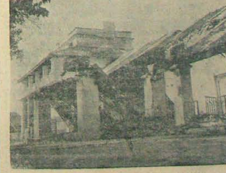
ముల్కీ వ్యతిరేక దృమకారుల కోపాన్ని గురించిన కలెక్టరు ఒంగోలు