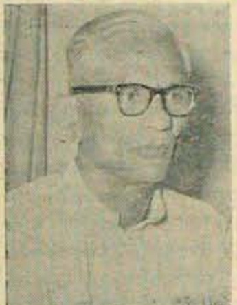
పదవి పరిధిలో లక్ష్యసాధన!

బాదు నగంలో అందు ప్రతి వర్షాన్ని గూర్చే అవిషయంలో వారు పాక్షికంగానే వైనా విజయాన్ని సాధించారని చెప్పాలి. అంటే నగరాల్లో 1977 వరకే మర్నీ నింధనలుంటాయని ప్రధాని చెప్పడం ఆంధ్ర మంత్రుల కోర్కెకు దగ్గరగానే వుంది. ఇప్పుడు వందరెడ్డిగారు 1974 వరకు గడువు ఇప్పించారు; దాన్ని వరో మూడేళ్ళవరకు పొడిగించడం జరిగింది.