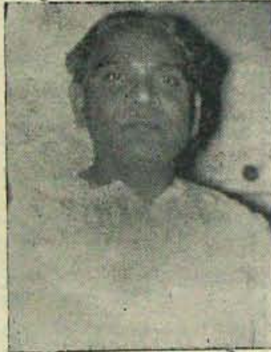
వచ్చినవని అయిపోయింది - ఇక ఇంటికి?

“ముందుకు మూడడుగులు వెనకకు ఒక అడుగు” అనే కమ్యూనిస్టుల ఎత్తు గడఁచు కాంగ్రెసువారు చక్కగా అభ్యసించుచున్నారని ముందుకు వెళ్ళు కొనిపోయి, కాస్త వెనకకువచ్చి కాళ్ళు నిలబెట్టుకోవడం అనేది యుద్ధవ్యూహాలకు కొత్తదికాదు.