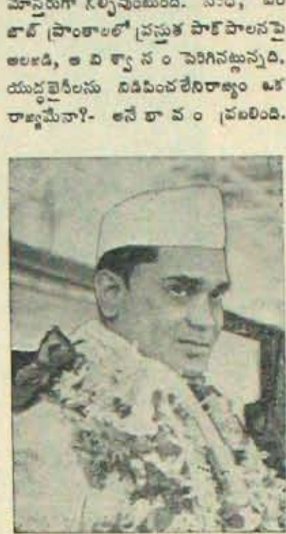
మధ్యప్రదేశ్ గజదొంగలను మామూలు పౌరులనుచేసిన శ్రీ జయప్రకాష్

నల్గొండయ నాయకుడైన జయప్రకాష్ నారాయణకు ప్రణమిల్లి. ప్రభుత్వ క్యానికీ లొంగిపోతున్నారు. తమసహచరులందరినీ లొంగబాటుకై వారు ప్రోత్సహిస్తున్నారు. జయప్రకాష్ ఈ పేర్లువంటే హడలిపోయే వారంతా వచ్చినే క్రవర్యంగా మీని దర్శిస్తున్నారు. (ఇది ప్రకటిస్తున్న సమయంలో ఈ గజదొంగ నాయకులు తమ అనుచరులతోటి లొంగిపోయిట్లు వార్త లొచ్చాయి. -సం.) అదార్య వివేచా భావేనో ఇది అరంభ మైనది. తన దేశమే గంగా జహతిహై దిక్రంలో ఈ లొంగబాటు కళనే దిలిం దారు. జయప్రకాశనారాయణ కృషి తో గజదొంగల అధ్యాయం సమాప్తకావల్సింది. వీహారులో అంత పెద్ద జైనులపై రక్షిండా డీయన్! బాంగ్లా దేశ విమోచనానికై ప్రవ్రథమంగా ఎంగెల్ల దాటి, అక్కరా తియ ప్రదారంచేసి, ఆ ఉద్యమానికి మాన్యతను సంపాదించింది! ఇప్పుడు మళ్ళీ ఈ 'గజదొంగలను' పట్టిస్తున్నాడు- బహుమానాలు మినహా! ఇటీవల రిటైర్ అవుతానన్నాడు ఈ మహనీయుడు. కాని వీదో ఒక సమస్య వచ్చివది రిటైర్ మెంట్ నుండి ఈయనను ఈడ్చివేస్తున్నది. ఒకవసలోనుంది ఇంకో వసలోకి రిటైర్ మెంట్! అది మనదేశంలో సంగతి. మిగిలిన పాకిస్తాన్- మన పొరుగుదేశం- మరొక బంగ్లాదేశ్ వర్యంతం అవుతున్నది. పాట్లాని స్టాన్, బలాదిస్టాన్ స్వయం పాలక రాష్ట్రాలుగా, అదరలేదుమైన భాగాలుగా పరిగణించబడితే, మిగిలిన పాకిస్తాన్ ఒక