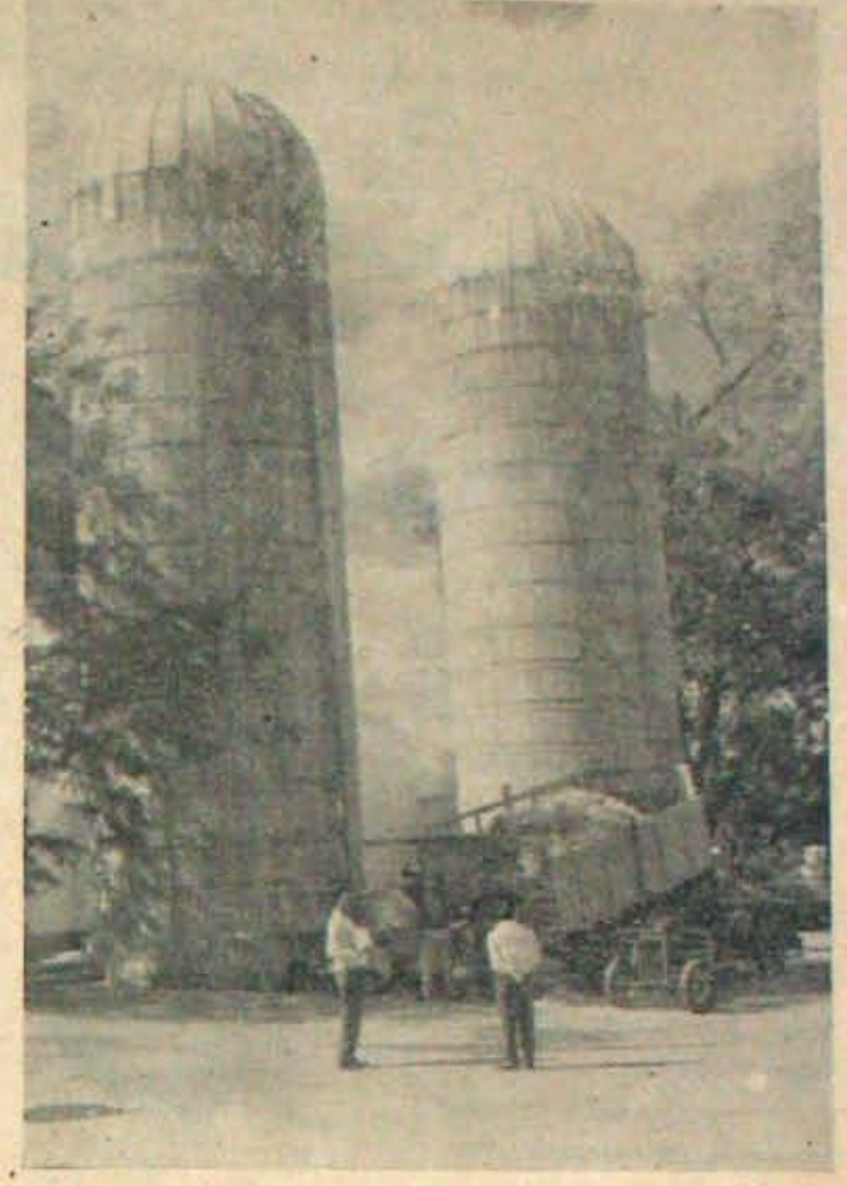
అమెరికాలోని ధాన్యము, పశువుల మేత గిడ్డంగులు.

మనదేశంలో తిండికారక లేకుండా వుండాలంటే, మనజనాభా పెరుగుదలకు సరిపడు అవోరోధాన్యాలు వుత్పత్తి జరగాలంటే ఇవి అవసరం. నేను, మరి కొందరం మిత్రులు సెప్టంబరు 2 తేదీ బతులుచేరి అమెరికా, యూరప్ దేశాలను సందర్శించాము. అక్కడి వ్యవసాయము, పశుపోషణ, పాడి పరిశ్రమ, కోళ్ల పెంపకం వగైరాలన్నీని చూచే భాగ్యం కలిగింది. ఈ దేశాల్లోని వ్యవసాయార్పి చూచిన నాకు మనం పాతకాన వున్నామనిపింది. వ్యతి రైతుకూ ఇటువంటి వ్యవసా పర్యటన అవసరమేమో ననిపింది. ఈ పర్యటనలవల్ల ఆ రైతులో మార్పురావడంగాను, అతని పరిసరాలు - కొరవ 11 వ పేజీలో