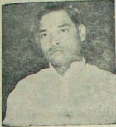
పి. వి. నరసింహారావు