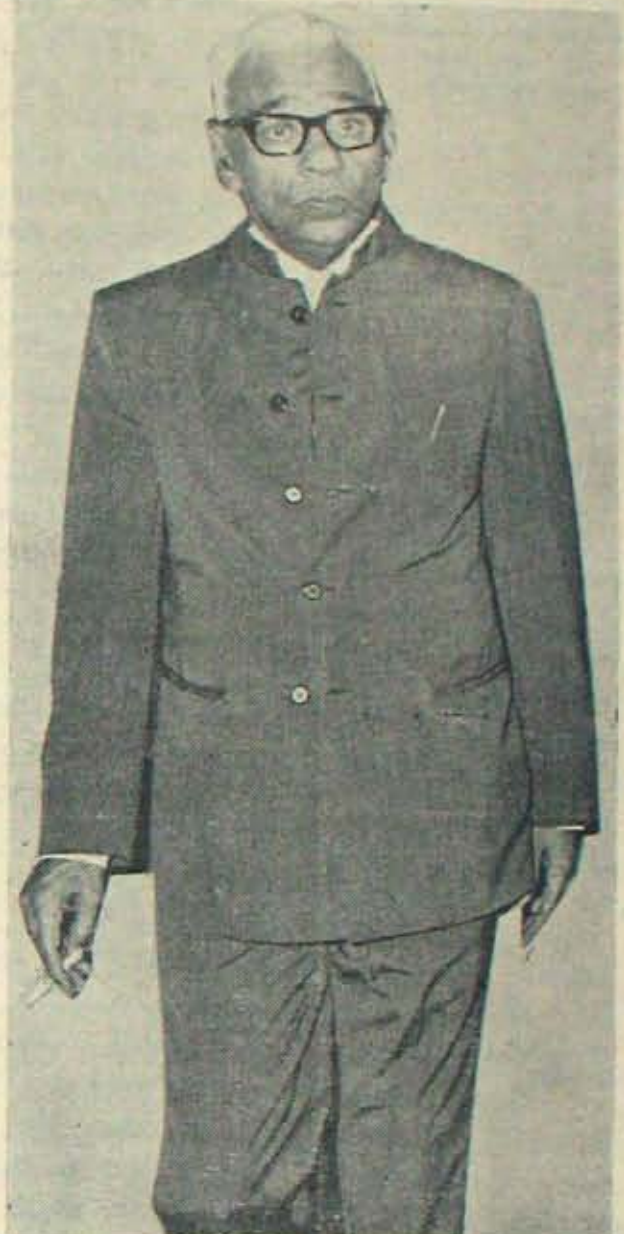
తెలంగాణ సమస్య తెగలేదు - ఎన్. జి. ల సమస్య తెలలేదు - సమస్యలంటే సరదానా మీకు?