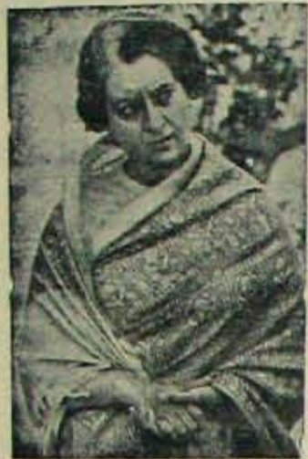
అందిరి ఇజాలకు సరిపోతుంది