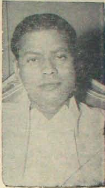
కాళాలు హెచ్చుగా వుండేది వర్కలపైనకూడా శంకుండ్డి.