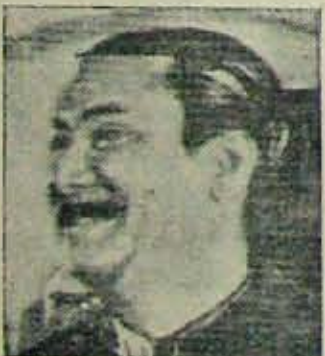
తూర్పుపాకిస్తాన్ విమోచనసభ మేజర్ ముజిబుర్ రెహమాన్

బాంగ్లాదేశ్ గాంధీ, లోహియాను ఒకే సమయంలో ప్రతికించింది సిగ్గుచేటు, మనం ఇద్దర్నీ చంపుకున్నాం, కారణాలే వైతనేమి! అవరక్షణకాదువైన మహాత్ముణ్ణి, అహింసామూర్తిని, తిట్టినాకొట్టినా ఎదురాడని పరమవైకృతమూర్తిని, నిరాయుధుణ్ణి గుండువేసి కాల్చినాము. మనదేశానికి పట్టిన దీడను వదిలింది నూత్రజ్యోతిని, అవర గాంధీవర, మనకు మావదానికి సిద్ధమైన