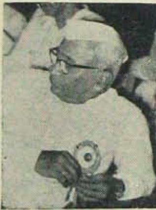
అంతబలం పెట్టుకొని మధ్యలో ఎన్నిక లేమిటండీ!

ముద్రలు పొందినవారికే వోటువేసి గెలిపించేవారు. స్థానిక పెత్తందార్లు మాటవినవోటుచేయలేదు నిజానికి ఇందిరమ్మకు వ్యతిరేకంగా వోటు చేయించాలని ప్రయత్నించి పలువోట్ల పెత్తందార్లు సంఘపెద్దలు వైఫల్యంజెందారు. ఇది ఒక రకంగా