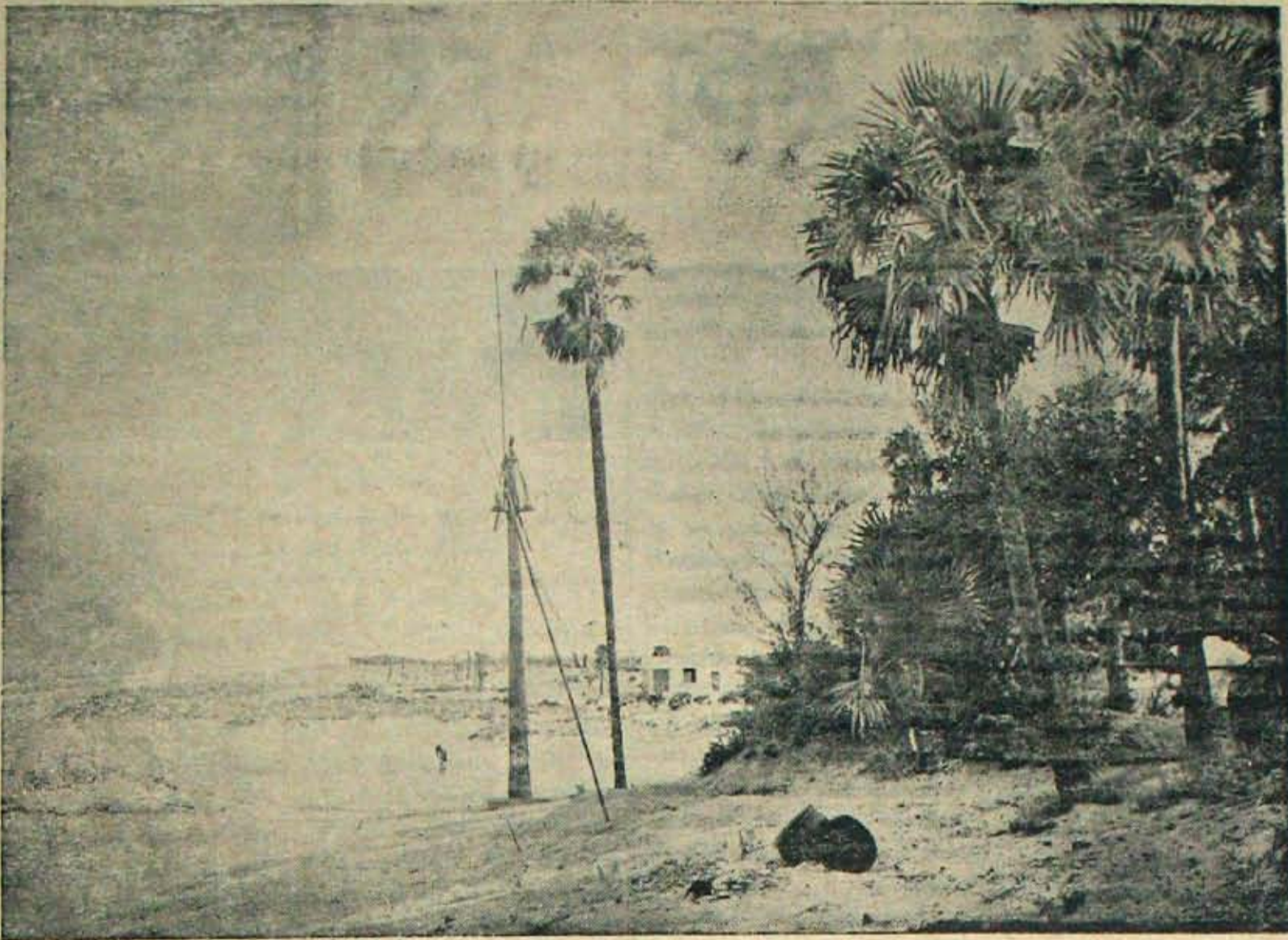
మైసాడు సముద్రతీర వికాసదృశ్యం: దూరంగా కనపడ తున్నది. కామేశ్వరి విహారశ్రేణిద్వారా పేరెన్నికగన్న టి. బి. - కళ, చంద్రికారాజుల హత్య జరిగిందని చెప్పబడుతున్న ప్లంట్ లాటిచెట్లకు వుత్తరంగా రెండుమూడు ఫర్మాంగులదూరంలో నిర్మాణముగా వుంటుంది.