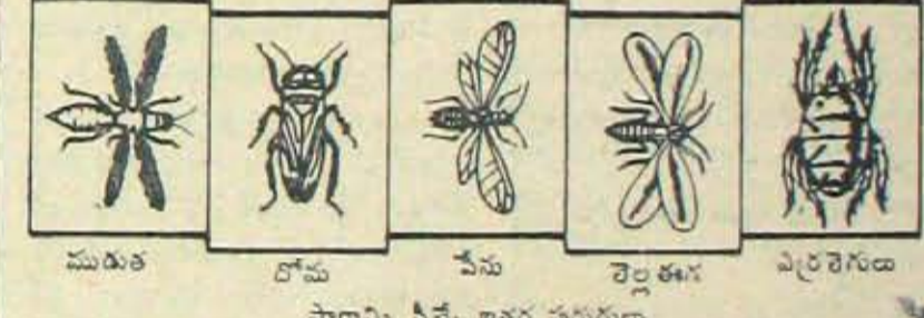
సారాన్ని వీరే ఇతర పురుగులు

నిజమైన సిస్టమిక్ కీటక సంహారిణి ఈ క్రింది వీడపురుగులను గొప్పగా నాశనం చేస్తుంది.