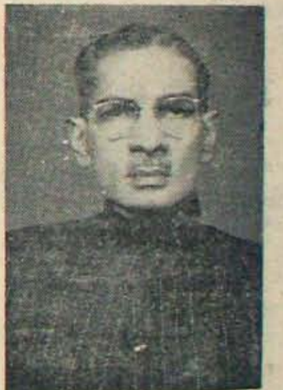
కందుకూరు డివిజన్ లోని అధికార కాంగ్రెస్ లో అనైక్యత ప్రకటించగానే కన విడుతున్నది. అది పార్లమెంటు అభ్యర్థిత్వం విషయంలో వుత్సన్నమైన అనైక్యతకారు. జిల్లాపరిషత్తులో రాజకీయవేదం ప్రారంభం - కారవ 9 వ పేజీలో