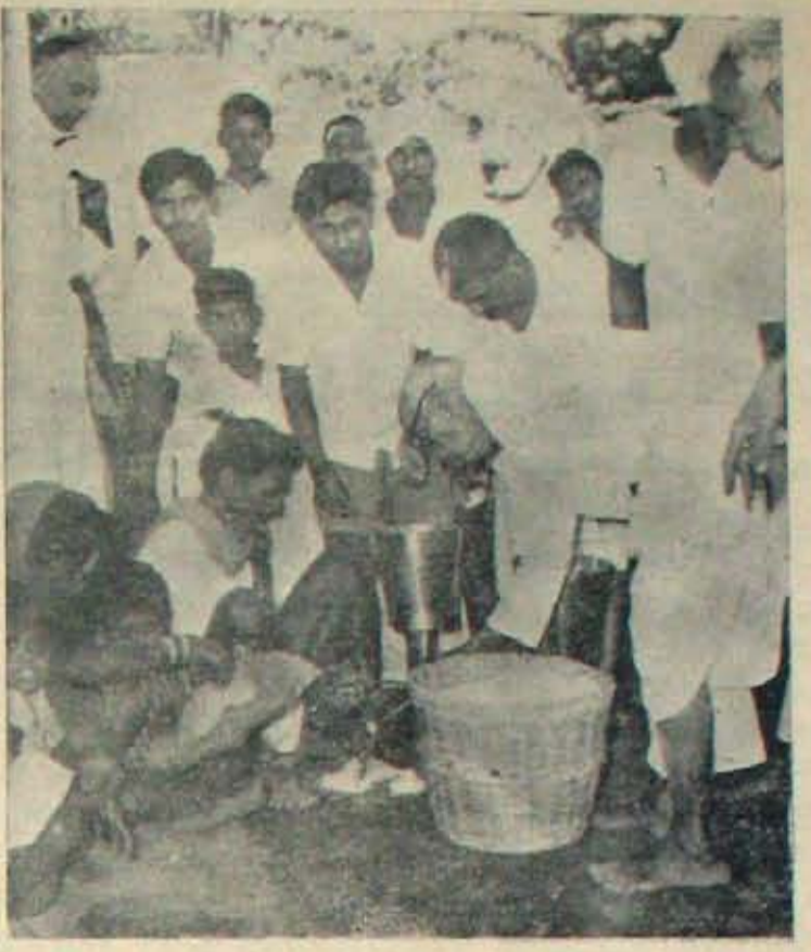
కావలిలో-శీతలపానీయం సంస్థగా అరచెట్టి శీతలాన్ని గడిపిన పెంజెం సోదా ఫ్యాక్టరీ! తేదీ వక్రొత్తవాన్ని జరుపుతున్నది. ఆ సందర్భంలో జరిగిన అన్నదాన దృశ్యమే ప్రైవేట్. పెంజెం సోదా ఫ్యాక్టరీ శీతలం శీతల పానీయాల సంస్థకాదు, ఒకరకంగా జాతియోధ్యమానికి వెచ్చని కూడలిగాకూడా వుండినది.

● కృష్ణావట్టుయగుకొచ్చి మేమువ్రాసిన దంతా మళ్ళీ ఏకరువు పెడుతున్నాడు ఒక 'విద్యార్థి'. మేము వ్రాయగల వాళ్ళమేకాని చేయగలవాళ్ళం కాదుగదా, సోదరా!