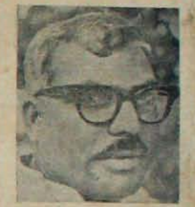
బిహార్ సం. సో. పా. ముఖ్య మంత్రి కర్పూరి రాజుగారి

ఇటీవల కొన్ని నెలలుగా కలకత్తాలో వారానికి సగటున పదిపన్నెండు మందికి