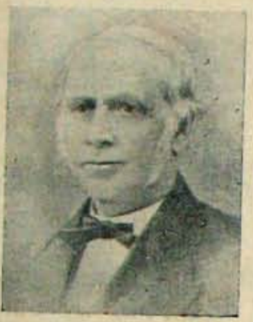
1848 లో నెల్లూరుకొద్దిన మరో ఆమెరికన్ మిషనరీ లెమూరెట్

వీమైతేనే - 'డే' గారు ఈ 8 ఏకరాల స్థలాన్ని తీసుకున్న వెంటనే ఈ కాంపౌండులో 1841 లోనే ఇప్పుడు టింపన హవుస్ గా పేర్కొనబడుతున్న బంగారాను కట్టించాడు. (వృస్తుకం టింపన వైలి గారు ఇందులో కాపురముంటున్నారు - ఇది లోన్