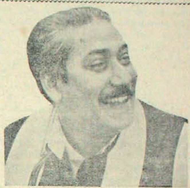
బండ్లా ప్రజాధినేత ముజీబ్ విమైనాదో? నియంత యాభ్యుక్తి కత్తికి ఎరకాకుండా ఈ ప్రజానాయకుణ్ణి సభ్యప్రపంచం రక్షించుకోలేదా?

రైల్వే మావోహార్లన్ననుసరించి విప్లవాన్ని సాధించడానికి పూనుకున్న సర్కారైట్లుకూడా ఈ విప్లవ కవులను నిరసిస్తున్నారు. ప్రైగా వీర విక్రమ కృష్ణ వట్లకాని, విప్లవ చైతన్యం పట్టాని తమకు విశ్వాసం లేదాకూడా సర్కారైట్ మేధావులు వాటి చెలుతున్నారు. భారత కమ్యూనిస్టు పార్టీకి, మార్క్సిస్ట్ కమ్యూనిస్టు పార్టీకి, ఇతర విప్లవ కమ్యూనిస్టు ముఠాలకు ఈ "విప్లవ" కవులపట్ల ఆదరణ గౌరవం కనిపించదు. అలాంటిది ఈ చేతివేళ్ళమీద రెక్కెంచవగిన