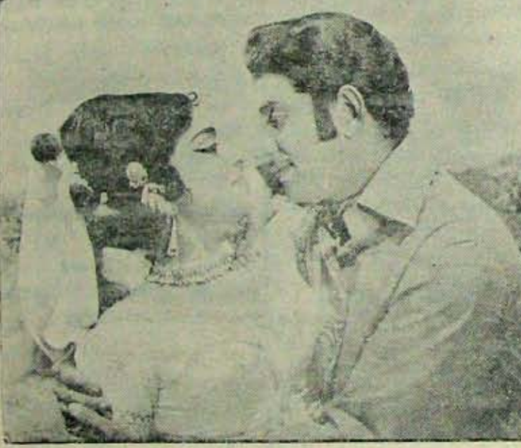
"మోసగాళ్లకు మోసగాడు" లో కృష్ణ - విజయనిర్మల

శ్రీ కృష్ణాంజనేయ యుద్ధం గయోపాఖ్యానం లాంటి కథకు శ్రీ కృష్ణాంజనేయ యుద్ధం కూడా దీన్ని శాంత శుభాభ్యాం నాటకంగా రాశారు. ఆంధ్ర దేశంలో నాటకం ప్రదర్శించడం కూడా ఉంది.