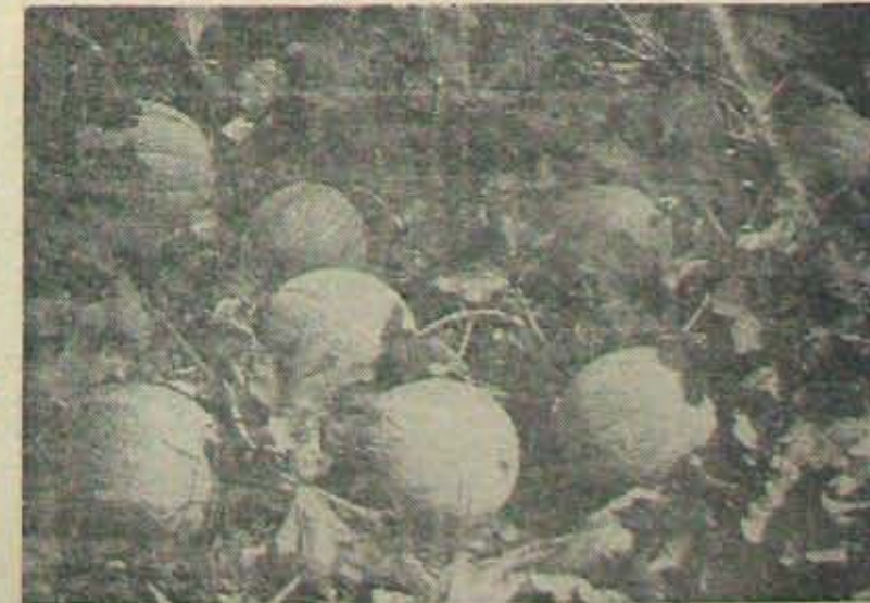
'పూసా షర్బతి' కస్తూరి పుచ్చరకం

చౌదరి - శేషాద్ర మొక్కలు వచ్చిన 15 రోజులకు హెక్టారుకు 35-45 కిలోల నక్షజని, 25 కిలోల పొహాపు అందించాలి. 20 రోజుల తర్వాత ఇదేమోతాదులో ఎరువులు వుట్టి చేయాలి. మొక్కలు అంకురించగానే ఎర్ర తరిసె పురుగుల దాడిచేస్తాయి. వాటిని మట్టు పెట్టడానికి 2 కి. శాతం డి. హెచ్.సి. లించిన -కొరవ 10 వ పేజీలో