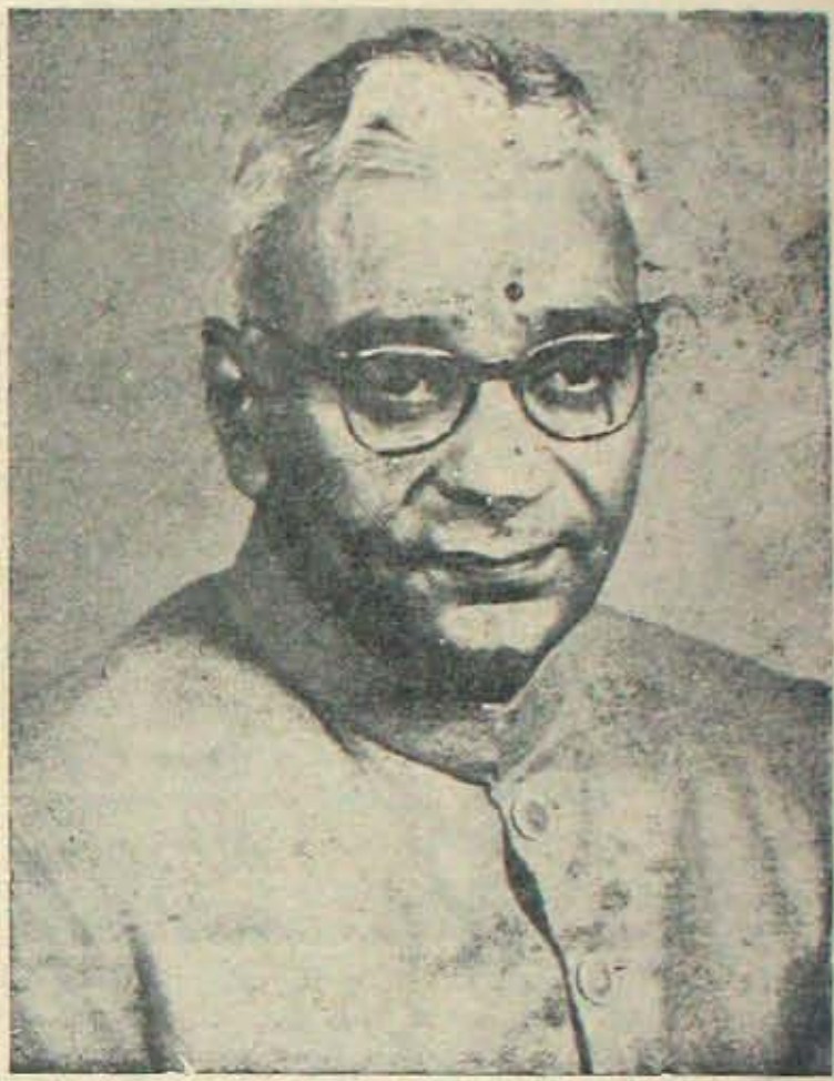
ప్రభుత్వానికి కీలక పాత్ర ప్రారంభమా?

*** ఒక రాజకీయ పరిశీలకుడు వ్రాస్తాడు: ఏ సూకల రామచంద్రారెడ్డిగారి వంటి తెలంగాణా నాయకుణ్ణి ముఖ్యమంత్రిని చేసి తెలంగాణా సమస్యను పరిష్కరించాలనేది ప్రధాని పుట్టే శ్యమని చెప్పారు. రెండేళ్లక్రితమే, ఇటువంటి పరిష్కారం సత్ఫలితాన్నే ఇచ్చి వుండేది. ఇప్పుడు తెలంగాణా సమస్య ఆ పరిష్కారానికి కూడా అలవికానిదిగా తయారైనదేమోనని పిస్తుంది. ప్రత్యేకరాష్ట్రవాదం ప్రజల్లోకి పోయింది; అదోక దుర్మహానంగాకూడా తయారైంది. అటువంటిప్పుడు శ్రీ బ్రహ్మానందరెడ్డిని తీసికొని కేంద్రంలో పెట్టినందువల్ల, ప్రజల్లో వ్యాపించేయ అధిపతి, నాటుకొనిపోయిన అభిప్రాయాలను తుడిచివేయడం సాధ్యమా? ముఖ్యమంత్రిత్వం ఇచ్చినందువల్ల పోయిన సమ్మతాలు వస్తాయా? రాష్ట్రవిభజన శాస్త్రంగా నిర్విఘాతమా?