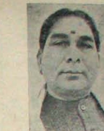
కమలా పత్రికపాఠి (ఉత్తరప్రదేశ్) కీలకమంత్రి తపస్యశేక్సె ఇప్పటికే వచ్చింది కాన్స్!