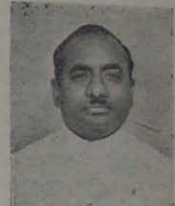
ఉపముఖ్యమంత్రి శ్రీ జె. వి. నరసింగరావు