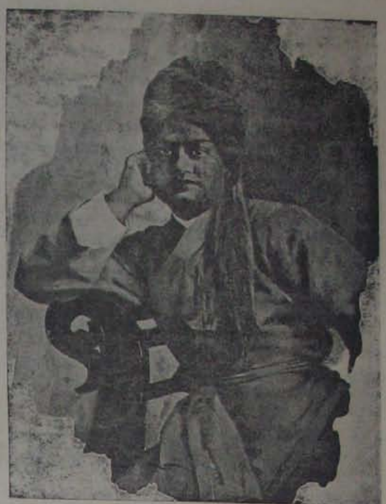
మళ్ళీ వ్యక్తి, దేశం బలపడి, నీతి నిజాయితీలతో కళకళలాడే దెన్నెమో, స్వామీ! స్వామీ వివేకానందుని కాంక్ష దిగ్గజం కన్యాకుమారి సాగర సంగమంవద్ద రాష్ట్రవతి శ్రీ వి. వి. గిరి గారిచే అభివ్యంజించబడింది.

దానికై ఈ విధంగా చేస్తున్నారు. 1967 ఎన్నికల తదుపరి కొన్ని రాష్ట్రాలలో అది కారణమంది కాంగ్రెస్ పార్టీ తొలగించబడినది. కొందరు మాజీ సంస్థానాధిపతులు- ప్రజలకు చేరువగా వున్నట్లు వారు- ఎన్నికైనారు. అంతట, మాజీ సంస్థానాధిపతుల ప్రతిష్టను నాశనం చేయడానికి చవాచో తదితర ఇండికేట్ నాయకులు పూనుతున్నారు. కుర్చీరాయుళ్ళ తమ వదపులలో లైకాయింపవలెనని సంకల్పించారు. అది ఈ పూనికకు కారణం." పార్లమెంట్ లో చర్చకు వచ్చిన పీపీ పర్సనల్ లిట్టను ఆవేశంతో అమోదించిన అమ్మకాశ్మీర్ మాజీ సంస్థానాధిపతి తండ్రి వికారాచల వళకంలో కలియడానికి ఆట రున సమ్మతించాడు. పైని ప్రస్తావించిన ప్రసంగంగావించిన వికారాచల మహారాజా తండ్రి ఆ వళకంలో కలియడానికి ప్రప్రథముడు. ఇది నిజం-ఇదే నిజం. మిగిలినంతా అబద్ధం కాదు గాని కేవలం ఊహకం, నాటకం. స్వామీ! వివేకానందా? నీ సూక్ష్మ శరీరం ఇప్పుడే పరిణామాన్ని పొంది వున్నదో తెలుసుకోగల శక్తి మాకులేదు. నీవుశక్తికి ప్రాధాన్యమిచ్చావు. భారతీయ