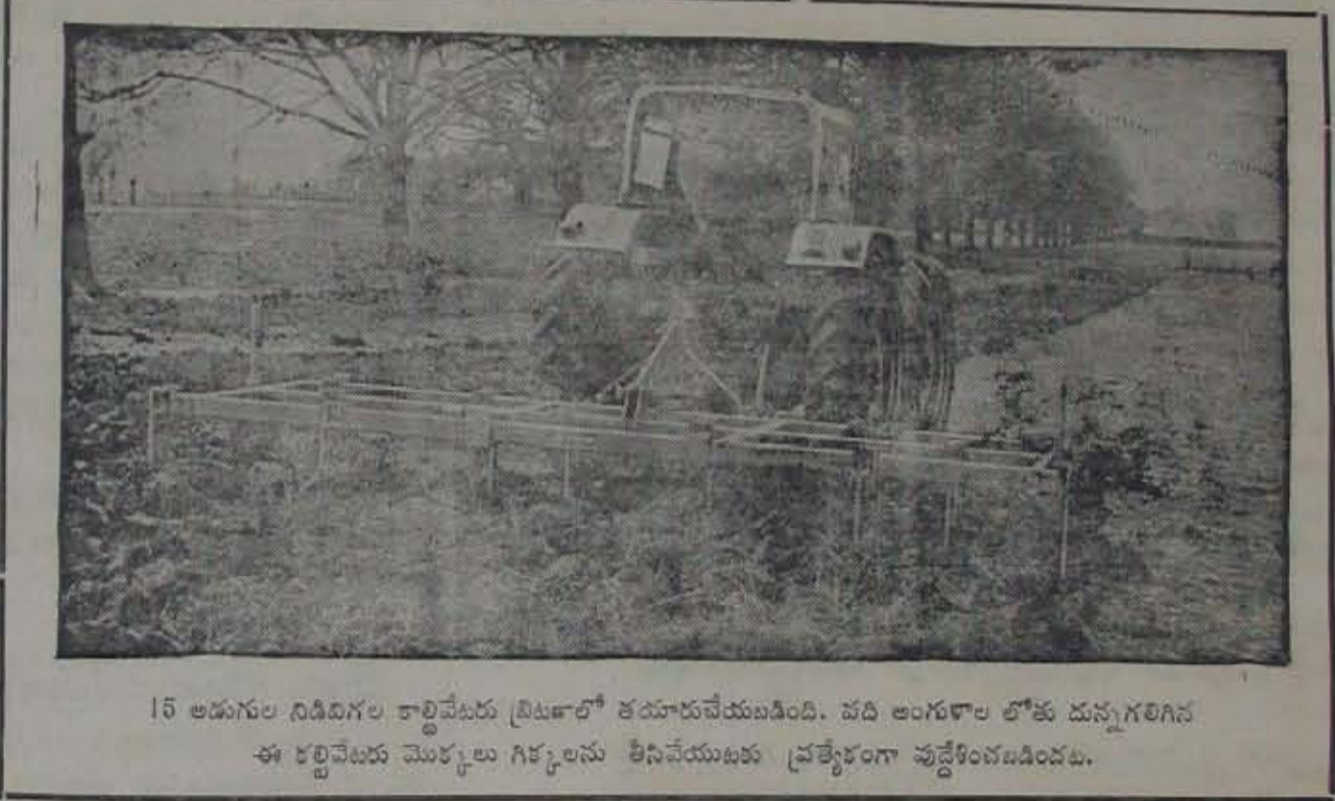
15 అడుగుల నిడివిగల కార్టివేటరు ట్రిక్టలో తయారుచేయబడింది. వది అంగుళాల లోతు దున్నగలిగిన ఈ కార్టివేటరు మొక్కల గిక్కలను తీసివేయుటకు ప్రత్యేకంగా వుద్దేశించబడినది.

విదాదిపాడుగునా కొబ్బరిచెట్టు కాస్తా వుండుటవలన వాటికి ఎరువులనుకూడా విదాదిపాడుగునా పరభరా చేస్తూంటారు. ఈ విధముగా వేసే ఎరువులను విడదీసి వేస్తూ, తగినంత నీటిని పెట్టుటవలన మొక్కలు మెచ్చుకాపు నిస్తాయి. ఏకరకంపు వురుగును నీటిలో ఒక శాతము వైకొకాస్-ఇ ని కలిపి చల్లబ ద్వారా అరికట్టవచ్చును. కొబ్బరి ఆకులను తినే బొంగళిపురుగును 0.2 శాతము డి.డి.సి చల్లబద్దవారా అరికట్టవచ్చును. కొబ్బరిమొక్కకు హానికలిగించే గండక బరితెవురుగులు బాగా వృద్ధిచెందే కంపోస్టు