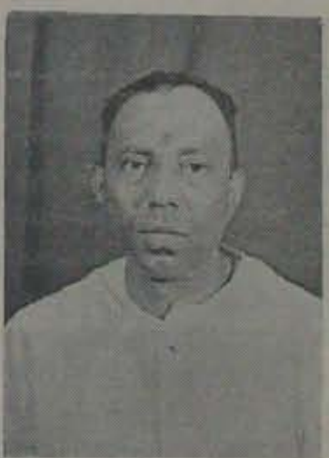
“నావల్ల నీళ్లు వదలడం ఆలస్యం కాలేదు” మంత్రి శ్రీ నారపరెడ్డి

అట్లు! కలసిమెనట్లుగా ఇన్నాళ్లకు, ఇన్నేళ్లకు కనువూరుకాల్వలో కొంతమేర కైనా నీళ్లు వదిలారు. అదే పదివేల అను కొందాం! 1 కోటి 40 లక్షల రూపాయలు మందినీళ్లపాటుగా ఖర్చయిపోయిన తర్వాత, పడేళ్లపాటు ప్యాజిటువని జరి గిన తర్వాత ఇప్పుడు నాలుగూళ్లకు చెందిన అరుచెరువులకు వెమ్మొకరాల ఆయకట్టుకు సరిపడా - మొన్న శనివారం 17 తేదీ సాయంత్రం శుభముకొర్రాన- రాష్ట్రమధ్యకరహా నీటివనరులశాఖ మంత్రి శ్రీ కొండా నారపరెడ్డిగారు తన 'అమృత హస్తాల'లో సంగం అనకట్టదగ్గర దక్షిణ వైపునవున్న కనువూరు కాల్వ ప్రధాన హాములై నీళ్లు వదిలారు.