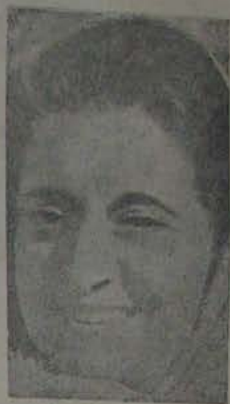
ప్రియదర్శిని కాదు- శక్తి స్వరూపిణి!

మన రాజకీయ వజ్రం ఈ పుస్తకం... దీనివల్ల మన రాజకీయ జీవితంలో తన పాట్నా సమావేశంలో చేసిన తీర్మానాలను అమలు చేయడానికి యోగ్యమైన కార్యకర్తలతో సురక్షితమైన పుస్తకం అందరు అనుభవాలతో, వివక్షగానో తీవ్రంగా కృషి చేయవలసివస్తుంది.