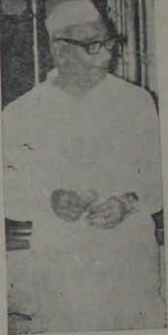
ఎన్ని ఎన్నికలు పోయినా ప్రత్యేక తెలంగాణాకు లోంగుబాటుకాని ముఖ్యమంత్రి

ఈ అన్ని కారణాలవల్ల ముఖ్యమంత్రి మంత్రివర్గ విస్తరణ సంకల్పాన్ని వదిలేశారు.