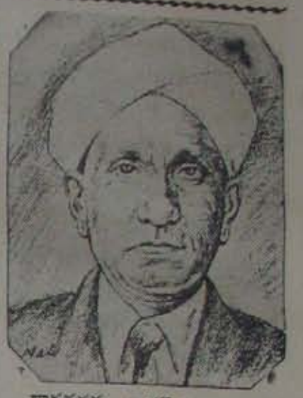
కారకర్త డాక్టర్ సి.వి. రామణ్ (చంద్రశేఖర వెంకటరామణ్) 88 వ ఏట వెంగళూరులో కన్నుమూసారు.