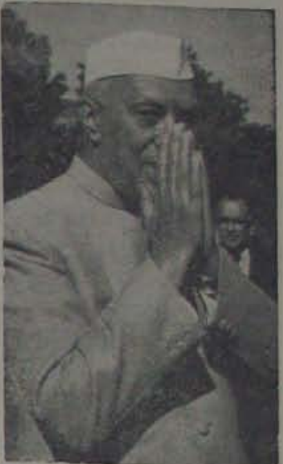
స్వర్ణవాసియైన జనమార్తీకి స్మృత్యంజలి నెహ్రూ 81 వ జన్మదినోత్సవం లేపే

ఇకపోతే ఖర్చులకు తగిన ఆదాయం వుండడంలేదు అనే వాదన వొకటివుంది. ఆదాయాన్ని తన హయాంలోనైనా పెంపు చేసే మార్గంలేదా? ఉంటే ఫేర్లెగాగారు అందుకుచేసిన కృషినిగూర్చి సదరు 'ప్రెస్ కన్ఫరెన్స్' లో తెలియజేసేవంటే పొరులు కాస్త సంతృప్తిపడి వుండేవారు. అట్లాంటి దేమీ జరిగినట్టులేదు. అసలు కృషిచేయడం - కొరవ 7 వ పేజీలో