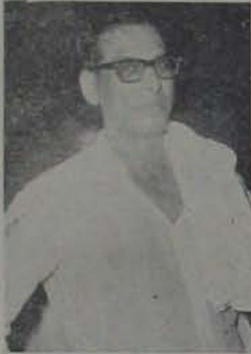
"ఫేర్లెగా వుండడం తప్ప నేను చేయగలిగించేమీలేదు!"

కున్నారు. అంతేకాదు మున్సిపల్ కౌన్సిల్ సవత్వరానికి ఆదాయం (వ్యభిక్షం నుండి వచ్చే గ్రాంట్లతో కలిపి) 20 లక్షలకు