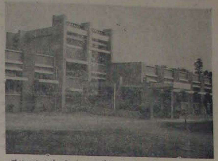
కోయంబూరులోని ప్రాంతీయ పరిశోధనాకేంద్రం. ఈ కేంద్రంలో ఇటీవల ఒక మంది పత్రికాన్ని స్పష్టించారు. ఈ పత్రికనుండి నూరొనంబరు నూలు తీయవచ్చును; దీనిమూలంగా అరబ్ దేశాలనుండి ఇటువంటి మేలుకలం వచ్చిన దిగుమతి చేసుకొనే అవకాశం తప్పిపోతుంది. ఈపత్రిక చాలాటి 'సుబాత' అని శ్రావ్యమైన పేరుపెట్టారు. ఈ పరిశోధనాకేంద్రంలో ఇంకా అనేక పత్రికలను స్పష్టించున్నారు. అంతేకాక బొమ్మ, మొక్కబొమ్మ, గోధుమ, సోయాబీన్ మున్నగు పత్రికలోకూడా అనేక కొత్త రకాలను తయారు చేస్తున్నారు.