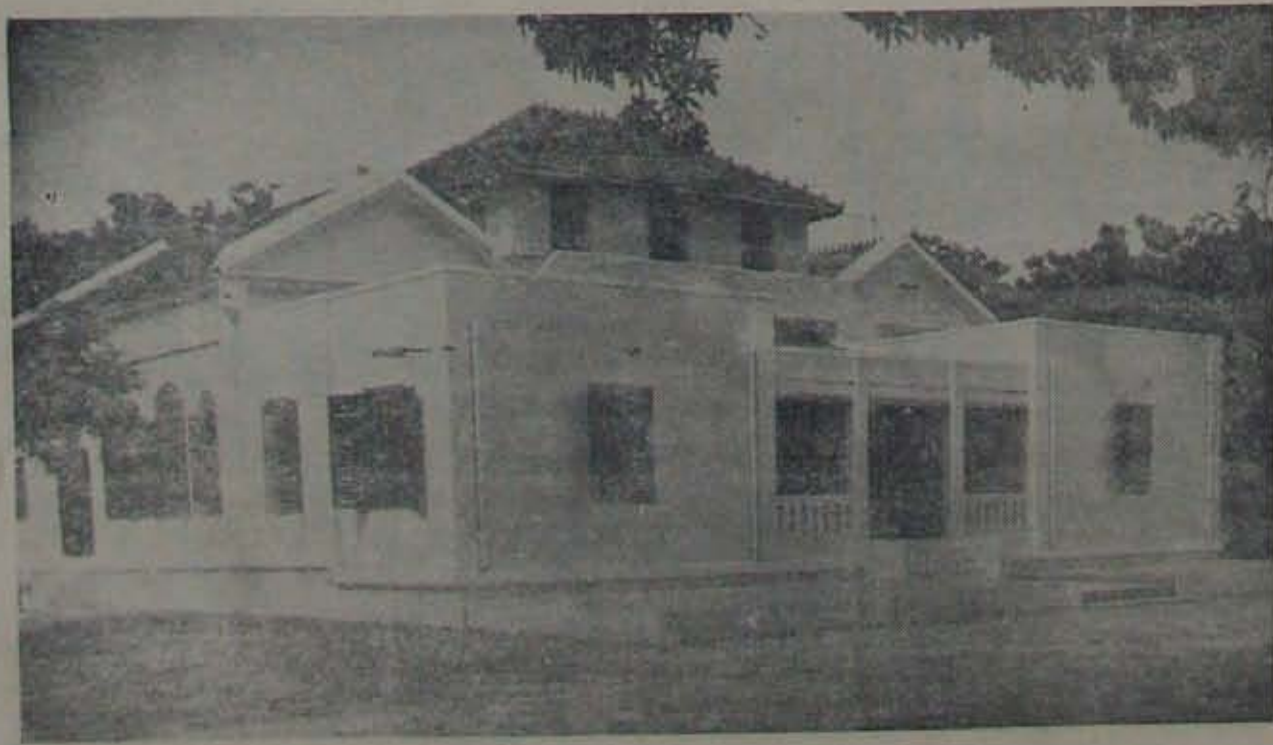
వాకాటి వీరారెడ్డి సత్రం (మద్రాసు) పాత భవనం

శ్రీకాకుళం విజ్ఞప్తి ప్రాంతంలో వని జేస్తున్న నగరైట్ దళంలోనే అసలు రీతి కలు వచ్చాయని తెలుస్తున్నది. పోలీసులు సాయుధులై ఎంతలాన్ని ప్రయోగించ గలిగినా, వుద్యమం జలహీన పడడానికి కారణం, ఉద్యమానికి ప్రజల సహాయం, లేక అందులో వారు ప్రత్యక్షంగా పాల్గొనడం ఆ క గ క పోవడమే యిందుకు కారణమని, గిరిజనులనుకాని ఘట్టుపట్టు వున్న ప్రజలనుకాని సాయుధ పోరాటానికి, విప్లవానికి తగినవిధంగా కయారు చేయకుండానే, విజ్ఞప్తిలో కార్యక్రమాన్ని ప్యారంభించజేసి, నగరైట్ (కమ్యూనిస్టు,