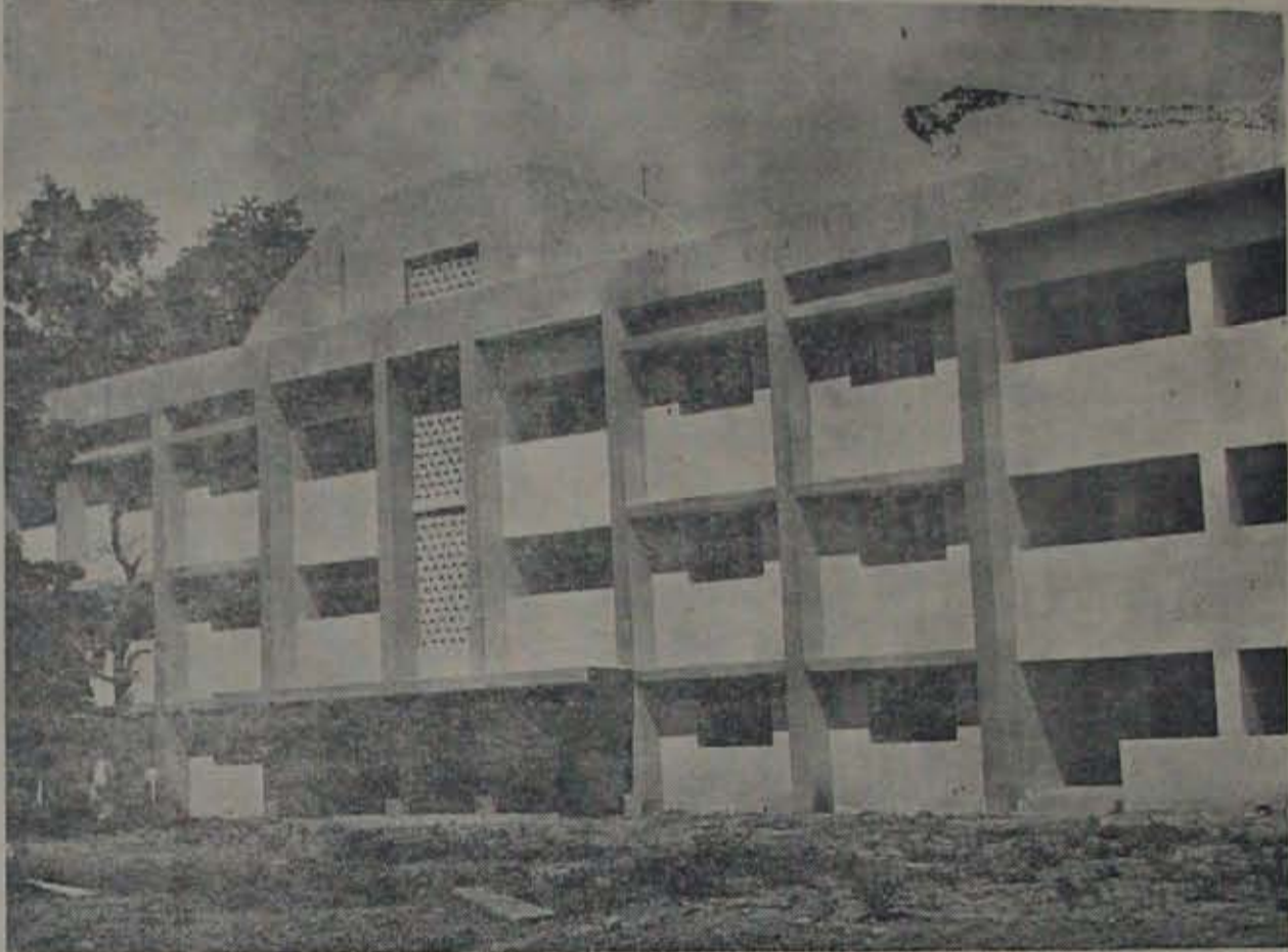
వాకాటి వీరారెడ్డి సత్రం కొత్తభవనం