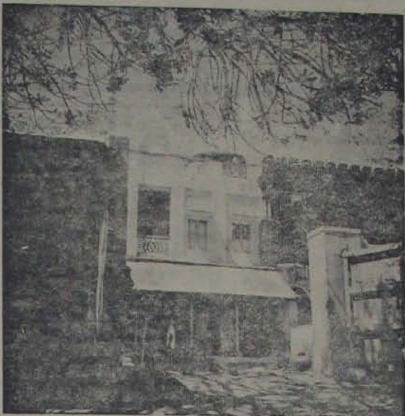
దివికోనుండి వచ్చిన వారి పేర్లు కనబడతాయి. పోలీస్ వారి సహాయంతో పాల్గొన్న వారి పేర్లు కనబడతాయి.

అయితే పోలీస్ వారి సహాయంతో పాల్గొన్న వారి పేర్లు కనబడతాయి. పోలీస్ వారి సహాయంతో పాల్గొన్న వారి పేర్లు కనబడతాయి.