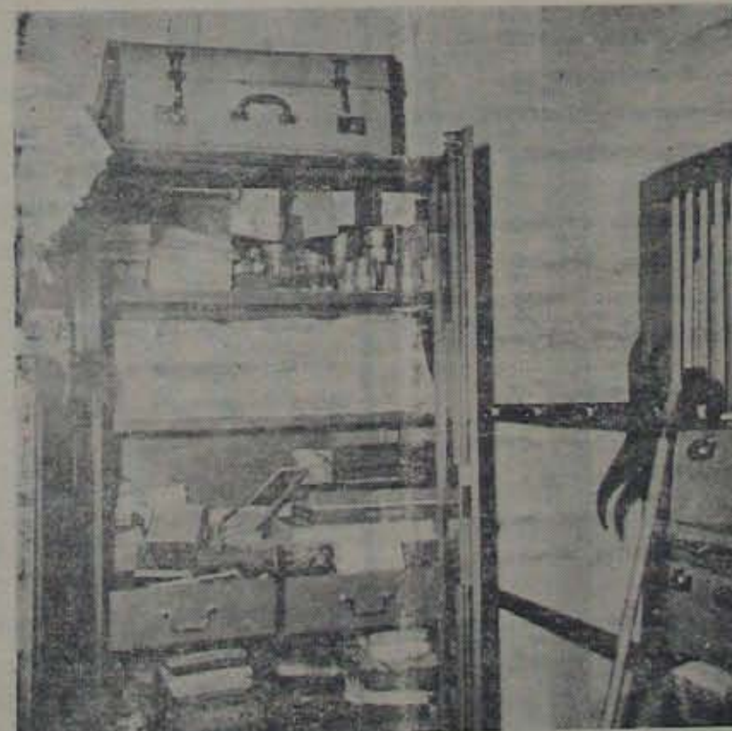
దివికోనుండి వచ్చిన వారి పేర్లు కనబడతాయి. పోలీస్ వారి సహాయంతో పాల్గొన్న వారి పేర్లు కనబడతాయి.

పోలీస్ వారి సహాయంతో పాల్గొన్న వారి పేర్లు కనబడతాయి. పోలీస్ వారి సహాయంతో పాల్గొన్న వారి పేర్లు కనబడతాయి.