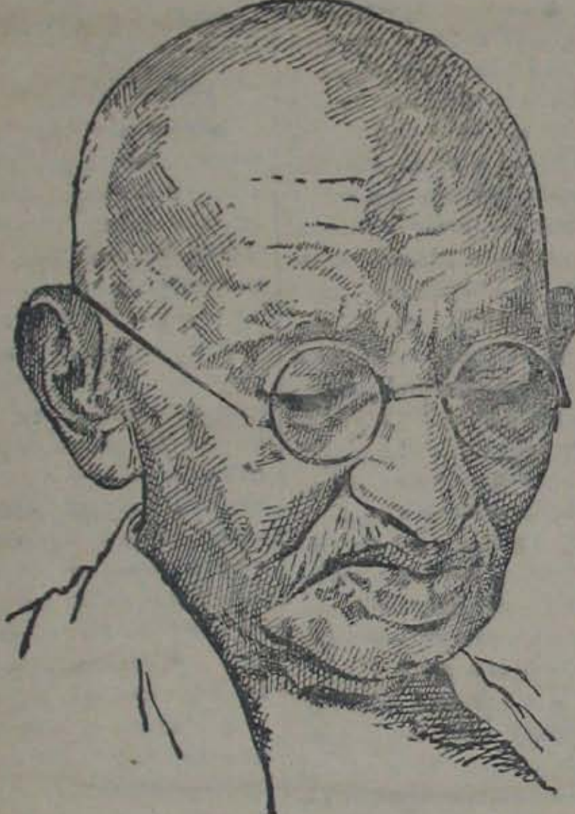
మహాత్మ గాంధీ జీవిత చరిత్ర (1869 నుండి 1948 వరకు) ప్రదర్శింపబడును

నెల్లూరు పౌరులకు సంక్రాంతి కానుక 18-1-70 తేది మంగళవారం నుండి శ్రీ వినాయక సినిమాలో భారత ప్రభుత్వ ఫిలిమ్స్ డివిజన్ వారి తెలుగు చిత్రం