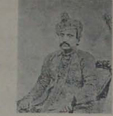
సంస్థాన గ్రంథాలయాన్ని సరస్వతీ నిలయంగా వాడుకలోకి తెచ్చిన

గుర్తు. ముఖ్యంగా ఆయాభాషలన్నీ సంస్థానాధిపతులకూ-అ సమకాలీన పండితులకూ గల సాన్నిహిత్యాన్ని సూక్ష్మవివరాలతో కూడావట్టి ఇచ్చేవిగావున్నాయి.