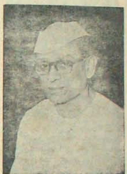
ఇక అహింస పోరాటమేనా?

కున్యట్టుంచిన సంజీవరెడ్డి చెప్పారు. కాంగ్రెస్ పార్టీలో అధిక సంఖ్యాకులు ఈ నిషేధాన్ని తొలగించాలని కోరారుకదా అంటే, మనపార్టీ నట్టుల సంగతి తెలియదా, చేసు ముఖ్యమంత్రిగా నున్నప్పుడు కూడా విరలాంటి ప్రయత్నం చేయలేదా, ముఖ్యమంత్రికూడా వ్యయంగా తొలగించడం అసాధ్యమేనా, పార్టీ నట్టులు ఏం చేయగలం? అన్నారు.