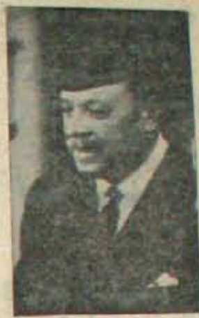
ప్రత్యర్థులమీద కనిపిస్తున్న అసాధ్యమైన పదవిపరిత్యాగం చేసిన నియంత అయ్యాడే

వ్యతిరేకం, రేడియోలు ఒక్కోరోజు ఒక్కసారి వార్తలను తెచ్చి ప్రసారం చేస్తుంటాయి. ఒక్కోరోజు వదవడానికి వార్తలుండవు; ఒక్కోరోజు వదవడానికి ప్రయత్నం చేస్తున్నామంటే కాంతి క్రమం లకు, సానుక సానుక, క్రమశిక్షణకు, కడకు త్రాగునీళ్ళకు వున్నంతకరవు; వార్తలకు వుండడంలేదు. పాకిస్తాన్ మాజీ అధ్యక్షుడు, మద్యం తర ఎన్నికలను తర మంత్రిత్వ నిర్మాణ ప్రమాదనాలు, ఇక మన తెలంగాణా పోషకుల దిట వదాల... కత్తం వ త్రి కా పాతకులకు కావలసినంతమేక నిస్తున్నాయి. ఇక అంతర్జాతీయంగా సుత్తి కొడవళ్ళ ముష్టియ్యుద్ధాలవంటి అసాధ్యమైన సంఘటనలు వుండనే వున్నాయనుకోండి!