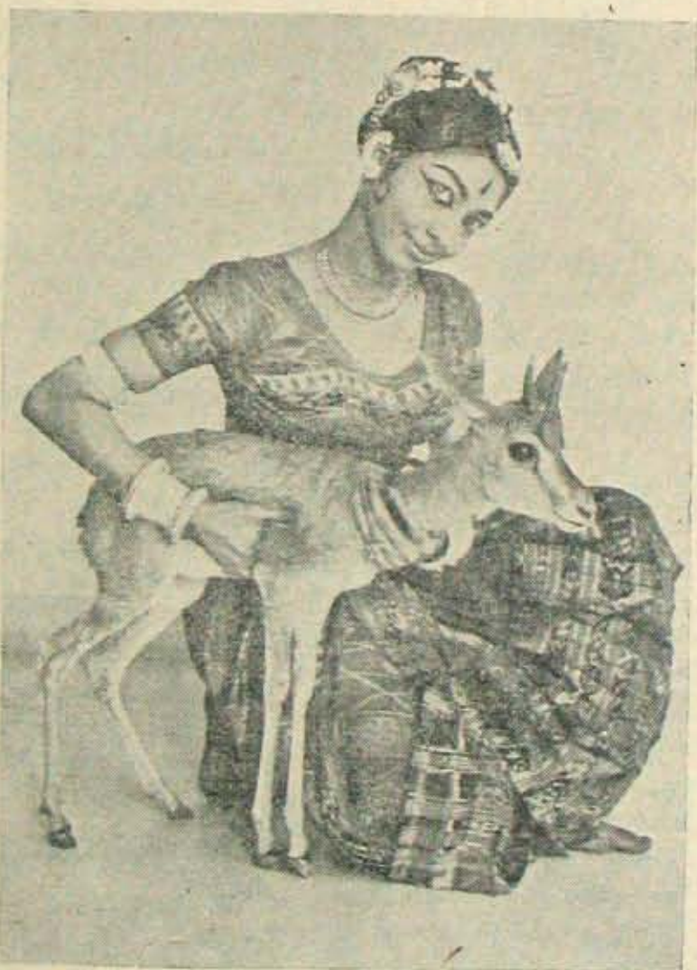
విఖ్యాత కూచిపూడి నర్తకి 'పద్మశ్రీ' యామినీ కృష్ణమూర్తి.