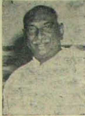
దుర్గాపూర్ ఎ. ఐ. సి. సి. లో కాంగ్రెస్ సోషలిస్టు పోరాట కమిటీకి తాను దొరక లేదు. అతనిని మహిమ నేతాశకు సుంట్రిల్ ఎల్కా కమిటీలోకి ఎన్నికై

అందువలన వెలువరించి కాంగ్రెస్ మీద తాకిడి తేగల శక్తి లేదని తెలుస్తున్నది. లోపలినుంచే ఒత్తిడి రావలెను. రాగలదా?