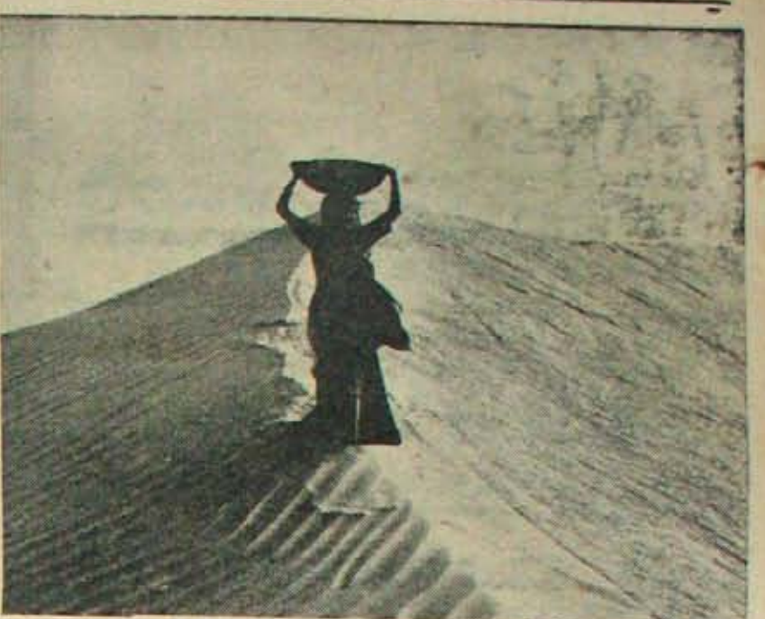
రాజస్థాన్ ఏడారి దృశ్యం ఇది. ఇక్కడ ఉష్ణోగ్రతను, దుమ్మును కంట్రోలు చేసే వంటలను పండించడం సాధ్యమని, అమెరికానుండి వచ్చిన శాస్త్రవేత్తలు అభిప్రాయపడుతున్నారు. ఇది ఎప్పటికీ సాధ్యమేమో!

నిరుల్లి అధికోత్పత్తి నిరుల్లి పాములను అధికంగా పండించడానికి ఎటువంటి స్థలం ఎన్నుకోవాలి, ఎటువంటి సారవంతమైన నీలలు కావాలి మొదలగు విషయాలను గూర్చిన వివరాలు తెలుసుకోవడానికి ఆర్. ఎమ్. పి. వ్యవసాయ కళాశాల క్షేత్రము, (నర్సర్)లో