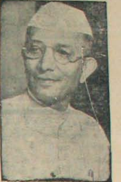
నీలంవారి రాష్ట్రపతి అభ్యర్థిత్వానికి తన మంత్రిత్వాన్ని బలియిచ్చు కున్న మొరార్జీ.

ఒక మహా స్వప్నం లాగా అరిగి పోయింది అపోలో-11 చంద్రమండల యాత్ర. అత్యంత జయపరంగానే ముగిసింది మానవుడి యా చరిత్యాశ్చకమైన యాత్ర. చంద్రగోళంపై తిరిగివచ్చిన అమెరికా అంతరిక్షయాత్రికులనూ, వాళ్ల లోడివట్టుకొచ్చిన చంద్రుడి మట్టిపెళ్లనూ శిలలనూ చోవ్చకలోని శున్యస్థాయిగా కాలలో పుంజుకారు మూడువారంపాటు. దీన్నే 'క్యాంప్రైజ్ పీయిట్' అంటారు. వాళ్ల మోసుకొచ్చిన అత్యంత సున్నమైన సున్నుకీళ్లవల్ల యీ మామండలంమీది మానవాళికి ఏవైనా విచిత్రమైనవ్యాధులు సోకవచ్చునేమోననే అనుమానాలతో యీ అతిగాగ్రతలన్నీ ఏర్పాటుచేయబడ్డవి.