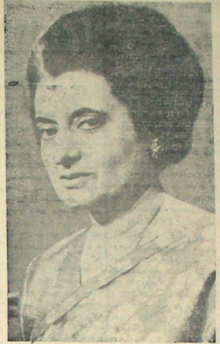
పోయిన ప్రతిష్ఠను పునరుద్ధరించుకున్న పృథ్విని

ఇంతకా ఎక్కడకు దారికిస్తుంది? 1972 లో బ్యాంక్ బాధియంవారు అది కారంలోకివస్తే మందింది. అందుకై ఇప్పటి నుండి తయారీ అవనరం. ఇక సిండికేట్-ఇండికేట్ ము కాలకు పోతుకుదరదు. తాడో, పేడో ఇవ్వడే తేలిపోవలెను. కాంగ్రెస్ పార్టీ సిండికేట్ వ్యప్తతే సిండికేట్ ఇక నమాన మనస్సులైన వజ్రలతో కలిసి ఒక ప్రచో విర్రకనుకో - కొరవ 8 వ పేజీలో - కొరవ 10 వ పేజీలో