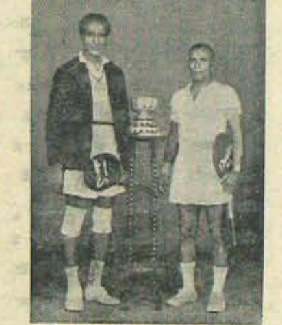
నేషనల్ లో గెల్చిన నెల్లూరు వెల్చున్ తెన్నినపీరులు

ఈ వజ్రలకు చెందనివారు, మాన్యులు, - కారవ 7 వ పేజీ