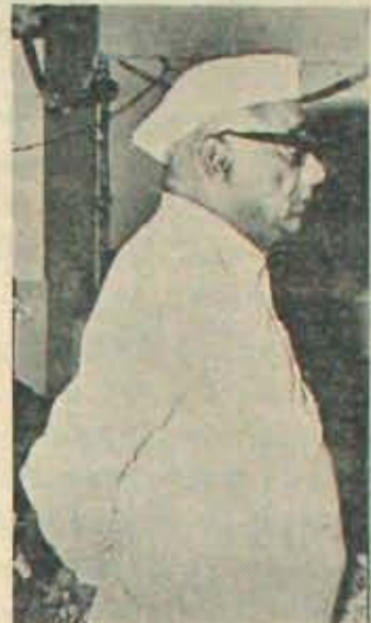
"మంత్రివర్గంలో హెచ్చుస్థానాలు దాలరు. అభివృద్ధి పనులు ఇంకా కట్టుదిట్టంగా జరగాలె"