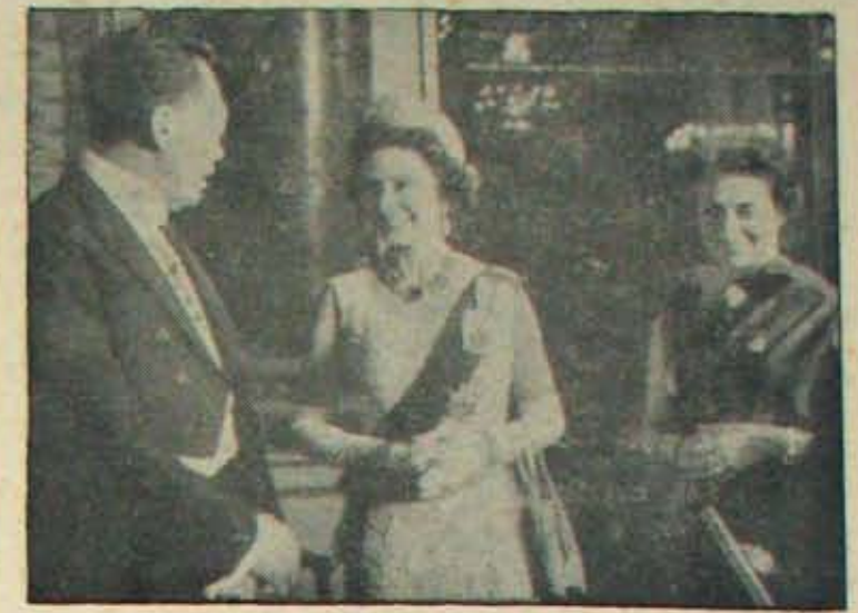
ఇటీవల లండన్లో జరిగిన కామన్వెల్త్ ప్రధానమంత్రిల సమావేశానికి పోయిన మన ప్రధాని శ్రీమతి ఇందిరాగాంధీ బకింగ్హం ప్యాలెస్లో ఎలిజబెత్ రాణిని కలసుకున్నది. చిత్రంలోని మరోవ్యక్తి సింగపూర్ ప్రధానమంత్రి శ్రీ లీకా ఈ.

అస్సాంలో బాగాలీలపై అస్సామీయులు జరిపిన అత్యాదారాల కథనం చదువరులకు తెలియనిదికాదు.