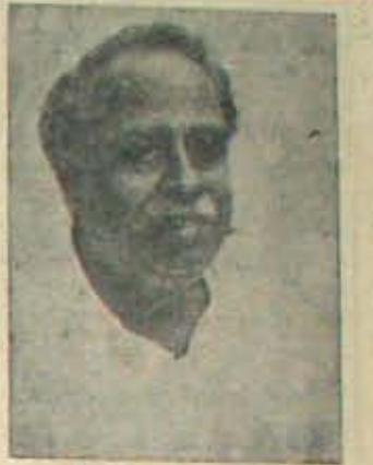
కీ. టి. అన్నాదురై

పూర్వయి ఎలక్షణ అధ్యాయం ముగుస్తుండన్నమాట. ఏయే ప్రార్థిల గోత్రాలు వచ్చి ట్టావుండేది యిటువడి పోతుండన్నమాట. 20 తేదీ:- ఉత్తరప్రదేశ్ లో బిగినిపోయిన బడు కొండ ప్రాంతాల్లో కూడా పోలింగు వుర్తువుతుంది. 6, 8, 10 తేదీ:- నాగలాండ్ లో రెండోదసాగా జోగుతున్న జనరల్ ఎన్నికలు వుర్తువుతాయి. అ అసెంబ్లీలో వుండేది 40 స్థానాలు. ఇది స్థూలంగా ఎలక్షణ పంచాంగం. ఎలక్షణ కబుర్లు పంజాబ్ ఎలక్షణలో కట్టుకొని వడి కొందరుకు 'కావాసింగ్' చేసినవే నేరంపై బోక సహకార సంఘాల అధికారి, ఇద్దరు - కొరవ 7 వ పేజీలో