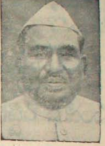
ఇందిరాకాంగ్రెస్ అధ్యక్షుడు శ్రీ జగజీవకారం. పాపం, మంత్రిత్వం పోయింది!