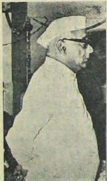
అధికారిని పోలికే ధిల్లికి ప్రయాణం?

ఇనవరితర్వాత హైదరాబాదుకుపోని ఈ విలేజింగ్, అనగరం ఏ గండరగోళానికి గురికానట్టే కనపించింది. ప్రశాంతంగావుంది. ప్రజలూ తమ వాస్తవికతలో నిమగ్నమైవున్నట్టే కనపడింది. హోటళ్ళు బజారులు అన్ని మామూలుగానే కళకళ మంటున్నాయి. అయితే ఏకైకంలో ఏ వుచద్రవం వచ్చినదాకుండోననే భయనందే హాలమాత్రం వ్యతిరేకంగా పీడిస్తున్నట్టే వుంది. బయటనుండి రాజధానికి రోడ్డుమీద వ్యయాణించేవారిమాత్రం నల గురు గుడి కూడినదృశ్యం కలిగివున్నది. మేము వ్యయాణిస్తుంటే ఒకరోజు తెలిపోనకాలకు చెందినవారు వదిలించి రోడ్డు మీద వదిలి వేస్తున్నారు. ఆ గుంపును దూరాన్నే చూచిన ఈ వ్యయాణికడికి అనుమానం కలిగింది. అట్టే అంకొంత దూరం పోయినతర్వాత, రాజీయాలలో విద్యవస్తవ్యక్తి వున్నట్టున్నాడు, కాదు గాని, ఒక తూముమీద కూర్చొని ప్రాన్సిస్టర్ పెట్టకొని, వార్తలు వింటున్నాడు;