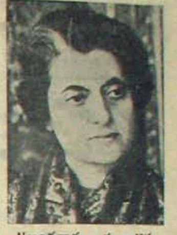
"అంతరాత్మల ముఠా"కు నాయకత్వం?