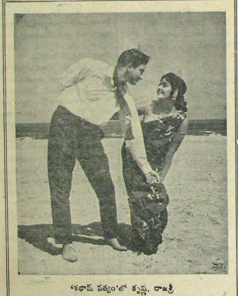
'శభాష్ సత్యం'లో కృష్ణ, రాజశ్రీ