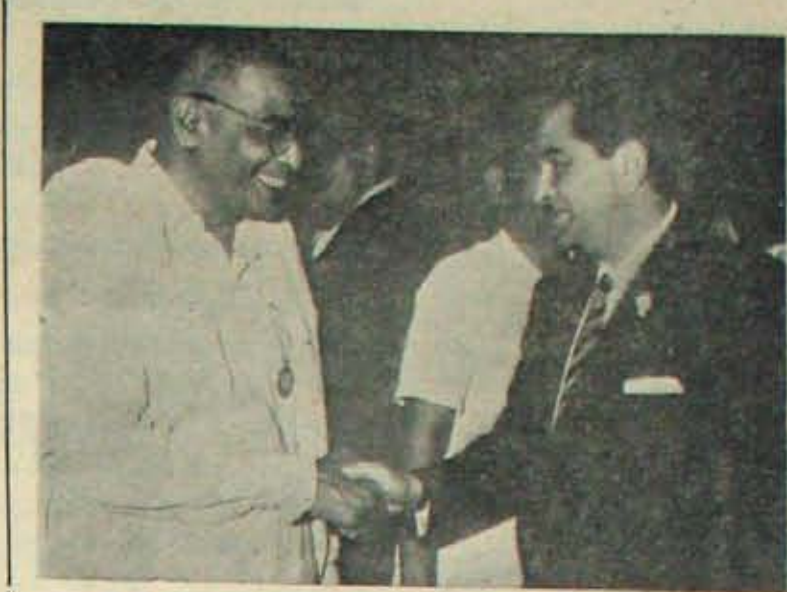
ధిల్లీలో పద్మశ్రీ నేదురుమల్లి బాలకృష్ణారెడ్డిగారిని అభినందిస్తున్న విఖ్యాత నటుడు రాజ్ కపూర్

చిత్రకల్పన బాపూ-రమణల కలలువంటి సాక్షి, బంగారువిడిక తర్వాతి యత్నం - చిత్రకల్పనవారి సరికొత్తయత్నం. గోదావరి ఒడ్డున ర్యాలి, బొబ్బిలంక, ధవళేశ్వరం, పులిడింది, ఒలిచేరు గ్రామాలలో ఘటింగ్ కొంత జరిగింది. సంతలో, ఎన్నికల సతలో శ్రీ అక్కినేని బృందం పాల్గొన్నారు. వాగేశ్వరరావు పూజారిచేపంలో