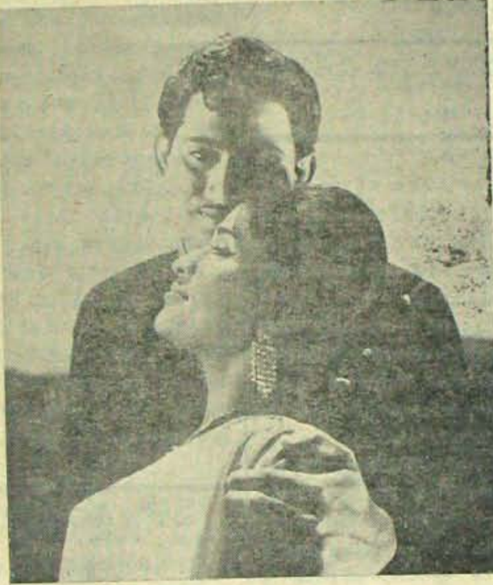
'చెల్లెలికోసం'లో కృష్ణ ప్రకృతవస్తుది చెల్లెలుగాలేదు.