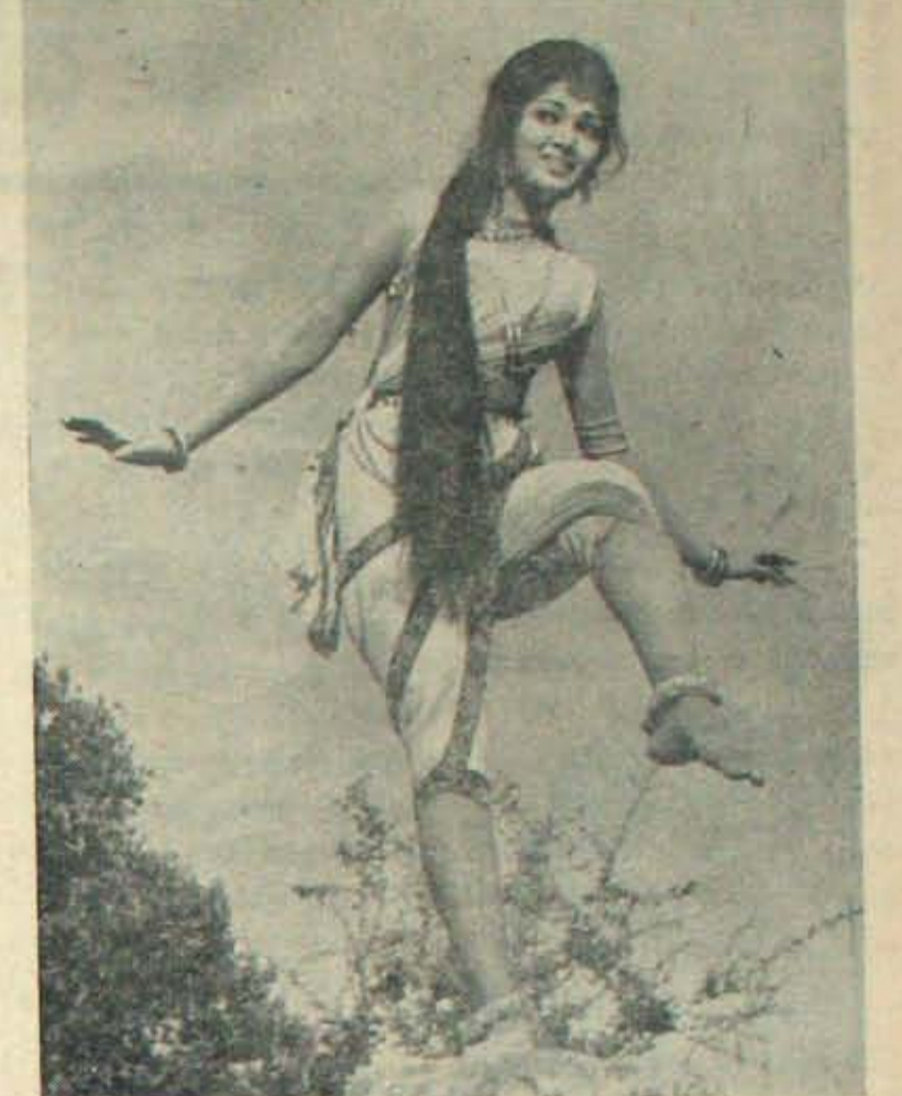
'వీరపూజ' లో వాసంతి

ఇంతమంది తన నిర్మాతలకు యిబ్బంది కలిగించేటిదులో తాను హైదరాబాదు మారటోవడంలేదని, మద్రాసులోనే వుంటానని, తన నిర్మాతలకు, తనను నమ్ముతున్న నిర్మాతలకు అన్యాయం చేయనని చెప్పారు. శ్రీ రామారావు వ్యక టన, దాహాన్నితీర్చే చలివేంద్యలా వున్నది. చాలామంది నిర్మాతలు నంకోషించారు!