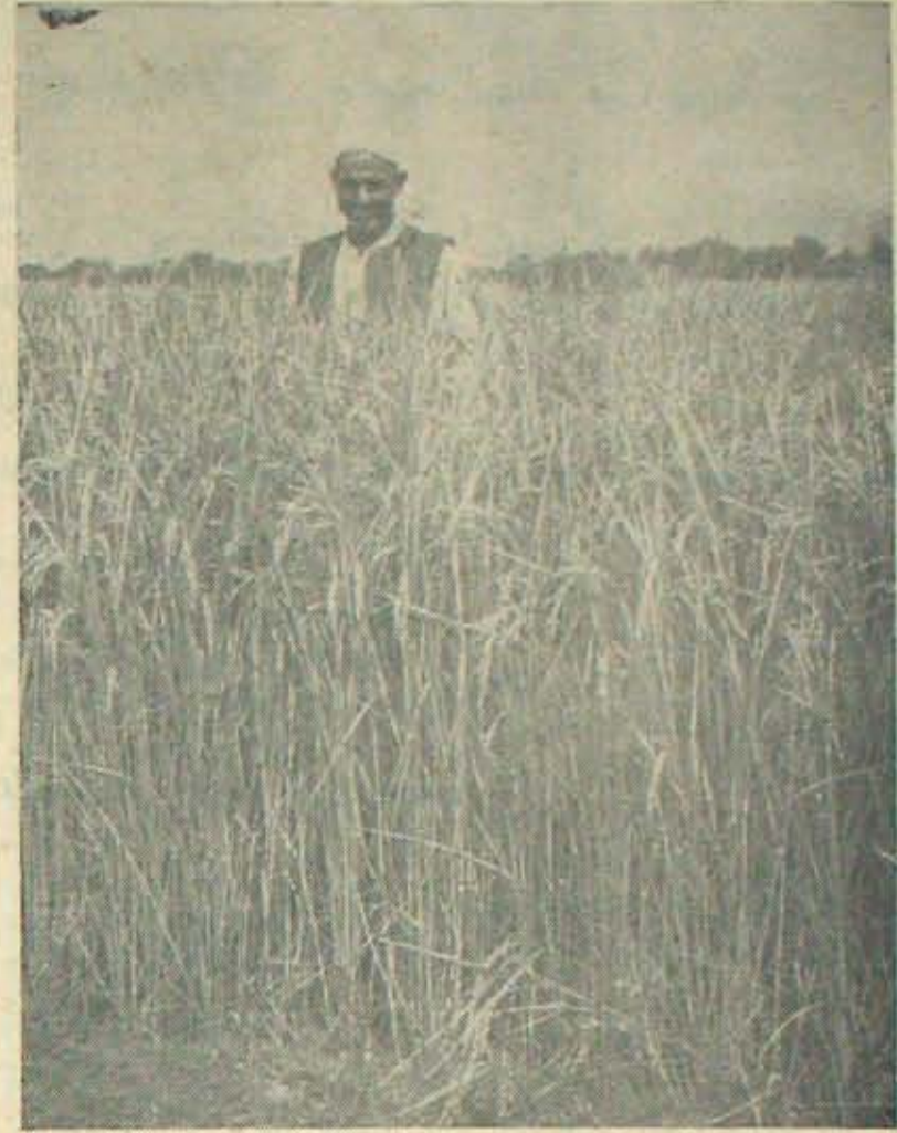
హెక్టారుకు 8250 కిలోల ధాన్యంపండిన వరిపైరుమధ్య కాశ్మీరురైతు మమ్మూలోనే

మధ్య 25 మొదలు 30 అడుగుల వెకల్యు ఉన్నదాయిను. అవకాశము వున్నచో పాదులు అన్నియు ఒక చదరవుగణం గుంటు కొట్టింది కొంతకాలం ఎండకు గారికి అరినకర్మాత వదరు గుంటలను వూళ్ళ వలెను. శ్రద్ధినవట్టి మందిదిగాకున్న చేరే మట్టిని కల్చుట శ్రేష్టము. కుట్టుచట్టి లేదా చెరువు, కుంట మట్టిచేర్చినను పొడివిరువు కలిసినను కొంతవరకు మంది. మొక్కలు నాడిన కడుకరి పొదుల శ్రద్ధ కం, నీరుకట్టుట, నీరుకొమ్మలను కత్తిరించుట, బీడపురుగులనుండి రక్షించుట; మొదలగువనులు యేమంత తెలియనిది కావు. చెట్టు పెరుగుకొలిచి పొదులను పెంది మధ్యభాగములో నాల్గు సంవత్సరములవరకు అనువగు పైరు వండించవచ్చును- 5వ సంవత్సరం చెట్టు కావునకు రాగలవు. విండికొలదికొద్దా అనే సామెత ప్రకారం నత్తువను బలముగావేసిన ఫలితముకూడా మిక్కుటముగా లభించును. ఒక యింకరమునకు రు. 2000 మొదలగు. 4000 వరకు ఆదాయము రాగలదు. వ్యవసాయ బద్ధులకింద శ్రీభాగము పోనే పోయినను నల్ల, రాగి, మున్నగు వంటల కంటే వ్యాపారవంటలగు ఫలవృక్షములు, రెట్టింపు వరుంబడి నివ్వగలవు. బల్లాయి తోటకు ముఖ్యముగా కావలసినది కపిలే దావి. వారమునకు ఒకతడిచొప్పున నీరు కట్టవలెను-వర్షాలకాలము అవసరములేదు- ఒక బల్లాయి మొక్కలనొకాడు, మందిగమ్మ నారంజ, కమలా మొక్కలుకూడా కనిగిరి - కొరవ రి వ పేజీలో