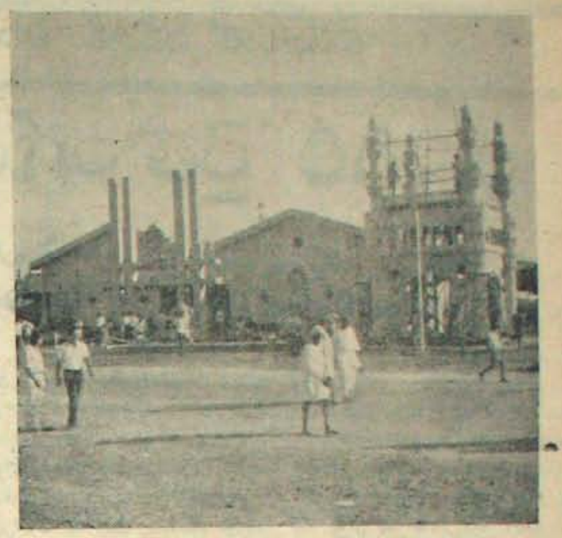
మద్రాసు అంతర్జాతీయ వాణిజ్య ప్రదర్శనశాలలో అధ్యాన్నంగావున్న ఆంధ్రప్రదేశ్ ప్రభుత్వ విభాగం.

అధికారం దేశంలో దుర్వినియోగమైతే, విదేశాంగ రంగంలో అవకతవకల కట్టగా తయారైనది. దాని ఫలితమే కద అవార్ట్! కాదంటారా? ఇక ఇప్పుడు మన కర్తవ్యమేమి? రాజాజీ, అయినకాశ్ వంటి ప్రాణ్ణాలు అవార్థను అంగీకరించమన్నారు. తిమయే, వాణిపాయవంటి వీరులు - శూరులు ఎదటి వారికి అంగుళం వదలకూడదని వాదిస్తున్నారు. వ్యభక్త్యం ఇందులో ప్రాణ్ణాలమాటే