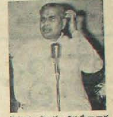
సాహిత్య, సాంస్కృతిక సేవారాజు నలతో సక్మాలక్షివం చేయడంబడు కున్న శ్రీ గోపాలరెడ్డిగారికి తల నొప్పిగా క యా రైం ది ఉత్తర ప్రదేశ్ చరిస్థితి!

చరణ్ సింగ్ న సేమిరా అన్నాడు; దాంతో ఎన్. వి. డి. అందారం లెటవడి పోయింది; నాయకుడులేని పార్టీ అయి పోయింది. కాంగ్రెస్ కు మెటారిటీ వున్న దనే సమ్మకం గవర్నరు శ్రీ గోపాలరెడ్డికి కలుగలేదు. అందువల్ల కాక్కాలికంగా రాష్ట్రపతి చరిపాలనను సిపారనుచేశాడు. ఉత్తర ప్రదేశ్ ఫిబ్రవరి 25 తేది రాష్ట్రపతి