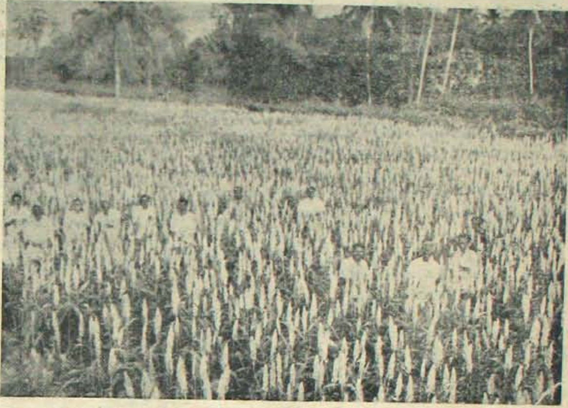
ఎకరాకు 4 పుట్టా ఫలితాన్నిచ్చిన అల్లిపురం సంకరకొన్న ఓత్త్యం వ్యవసాయశాఖాధికారిగారు, ఆరక్తి అందించేకంటల రైతులకు యాత్సాహ్యంమైపోయింది. నిత్యం ఎంతోమందివచ్చి చూచిపోతున్నారు. విరగవండిన నామువైరును; దాని మధ్య నిల్వొని వున్న వ్యవసాయశాఖ డిప్యూటీ రైరెక్టరు శ్రీ సుబ్బరాజు వ్యభిక్ష్యఅధికారిగారు, ఆ ఫలితాన్ని తీసిన రైతులను విత్త్యంబోధించాడనచ్చు.

ఐ. ఆర్. 8 సాగు వ్యయచయానంతో కూడినది. అక్కసుకు, అర్కుకు తగినట్లు ధరవన్నప్పుడే రైతు వుత్సాహంగా విశేష కృషి చేయగలగుతాడు; వ్యభిక్ష్యంనండి ఆ పోత్సాహం రానవచ్చు, రైతు అంత శ్రమవడలేడు, అంతభారం మోయలేడు. 0 2 సా త్య వదలిపెట్టడమంటే వ్యభిక్ష్యం ఐ. ఆర్. 8 వంటి అధిక దిగు అడి రకాలకు ధరపెంచక తప్పదు.