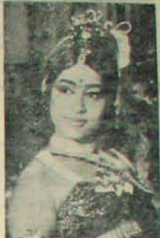
'భలే మొనగాడు' లో గీతాంజలి.

కొత్తకొన్ని నర్మవేళలలో జగ్గయ్య, బానకి నటన సెలెబ్రేషన్లవంటివి, మొత్తం మీద మామూలే. రంగారావు పాత్రకు ప్రాధాన్యం బొత్తిగాలేదు... దాక్టర్ గా సావిత్రి గ్లామర్ పెరిగింది. జమున అంటే గిరికపై మనసు పెంచుకున్న కులపోతుగా, కృష్ణమూర్తి బాగానటింది, రాజు చూపించినా, పాత్రకన్న మనసి బరువైనాడు. నటనకన్న 'అహం' ఎక్కువ కనిపించింది. కళాకారుడుగాకన్న నటుడు గా ఎదిగి పోయాననే అదిక వంకృప్తివల్ల పాత్రను మింది నటించాడుగానీ, పాత్రలో తీరించ