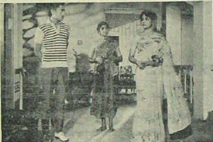
'సుడిగుండాలు' చిత్రంలో ఒక సన్నివేశం.

బొంబాయిలో సినిమాలు నిర్మాణం అగిపోయినపుడు బసం అంతగా వట్టిం కోలేదు. గణంగా సినిమాలు తయారు గాకపోతే మందిడే అనుకున్నారు. తిరా