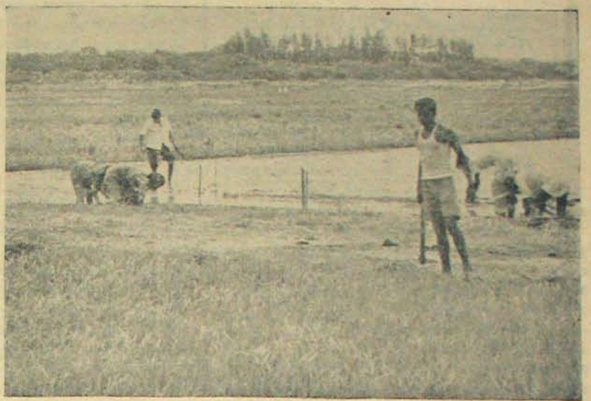
హైదరాబాదుకు అరుమైళ్ళలో వస్తు రాజేంద్రనగర్ రైలాంగానికి పదిక క్షేత్రం. కొత్తకొత్తవరి తదితర కరణాల తయారీకి అధికాంతంగా వరికోదనాకృషి అరుగుతున్న క్షేత్రం. ఆ వరికోదనాక్షేత్రంలోని ఒక భాగమే పై దిశం.