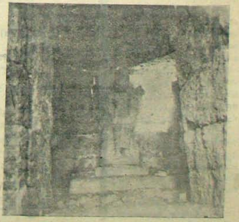
నిత్యపూజాదికాలు జరిగి ఎన్ని దశాబ్దాలదాటిందో; తూపిలి వెంకేశ్వరునిఅలయంలోని విగ్రహానికి దిద్దిన నామాలు నిన్ను నేడు దిద్దినట్లు ప్రస్ఫుటంగావున్నాయి. అదే అశ్రుర్యాన్ని గొలిపే విశేషం.

బ్రహ్మలింగేశ్వరాలయంలో నిత్యనైవే ద్యాదులు అరుగుతున్నవికాని, రిపేర్లు దాల అరగాల్సివున్నవి. నరే, వెంక శిశ్యులయంమాత్రం పూర్తిగా పాడువడి శిధి లావనలోవున్నది. అబదుషాజ, వుత్సవం ఎక్కడు అరిగిందోకాని, కొన్ని దశాబ్దాల మొదటిది బ్రహ్మలింగేశ్వరాలయం; —కారవ 10 వ పేజీలో