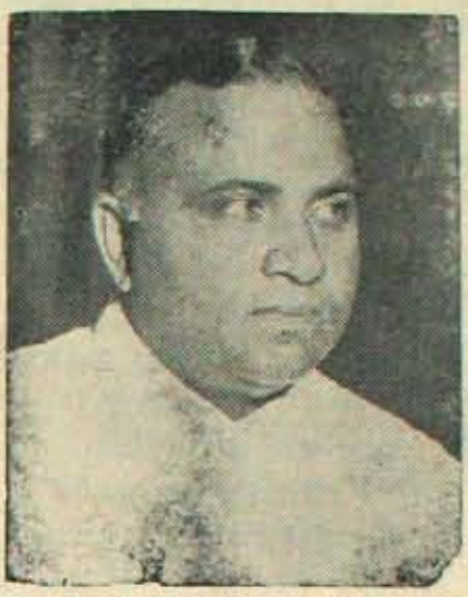
విధాన పరిషత్తు అధ్యక్షత