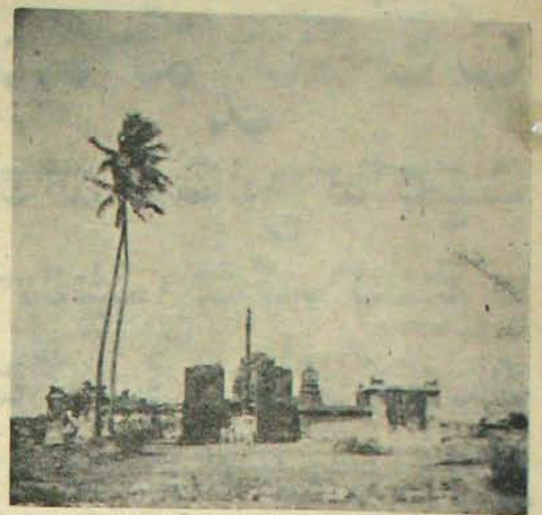
తూపిలిలోని శిధిలాలయాలు - బ్రహ్మేశ్వరుని దేవాలయం

పోయినానానాకేకేకావలను పెట్టెట్ల ప్లాటఫారాలుగా కట్టినవాటిమీద కంపు నీటికో కడిగి, అనీటిలో కంపోస్టుకుచ్చల్ని తడిసేనాకి వదడం మందిది. ఇట్లా చేయడంవల్ల కంపోస్టు శాస్త్రీయస్థాయి మెరుగ్గావుంటుంది. ఇదీ మనవారు పాటించడంలేదు. కనీసం ఆ దిపోలదావాకావాలి పైవును పోల్చిన పాపానపోలేదు మన మున్సిపాలిటీ. అట్లే ఎంట్రిక్ న్నరాలు బాద అక్కడ దాకా వెళ్ళరీయలేదు. కనీసం కిరనవాటిలో లాంకర్లుకూడా సరి పోయినట్లులేవు. ఇకపోతే కామిక్కులు, దిల్లపెంకులు, ఇ నవ ముక్కలు, రాళ్లు - రవ్వలు - —కారవ 10 వ పేజీలో