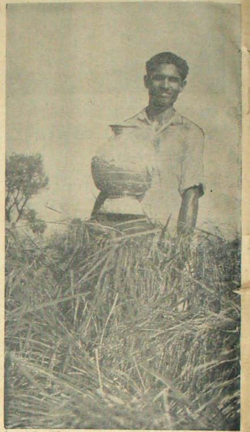
హెక్టారుకు 130 క్వంటాలు వరి పండించి రాష్ట్ర ప్రభుత్వంనుండి రజత కలశం గెల్చిన యువరైతు వరి మడిలో నిల్పున్న దృశ్యం.

దీని అర్థమేమిటయ్యో అంటే- శ్రీరామ చంద్రుడు పరిపాలించిన ఆయోధ్యా నగరంలో రంగవతి అయిన వున్నదని వొక ప్రతీతి. ఆ రంగవతి అయిన బ్రహ్మచర్య వాల సందర్భంగా జరిగిన విష్ణుమూర్తి కళ్యాణోత్సవాన్ని శ్రీరామచంద్రుడు కడు వేడుకతో తిలకించాడు- అనే అర్థంతో ప్రేమవ్యాన్ని పూరించాడు. బ్రహ్మచేత యివ్వబడిన విహానమున ప్రకాశించు - కొరవ 10 వ పేజీలో