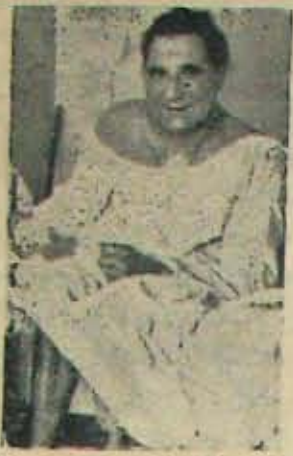
తన జన్మగుండె స్థానే 25 ఏళ్ళ అమ్మాయి డెసిడాల్సెల్ గుండె కాదును పెట్టుకొని లేచి కూర్చోని మాట్లాడుతున్న వాళ్ళెన్నికూ.

రెండోవారాకల్లా కరిస్థితికొంచెం విక డించింది డివిసిటిల్లో కొట్టిగా వొప్పి నడం ప్రారంభించారు. కొట్టిగా జ్వరం కూడా వచ్చింది. చచ్చినప్పుడు గళ్ళకూడా కడం ప్రారంభించింది. ఎక్కిరేకిస్తే