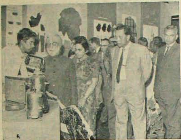
మద్యాను విగ్నివిషన్ లో నెల్లూరు సంగతులు