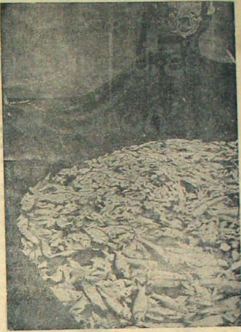
మత్స్యపరిశ్రమాలివ్వడానికి ఎంతో అనువైన ప్రదేశం వురికాల్ సరస్సు. ఈ వురికాల్ సరస్సులో చేపలు వట్టడమే సైద్యశ్యం-ఆ చేపలు వట్టేవాడి వంటకం డింది. -'హిందూ' సావన్యంతో.