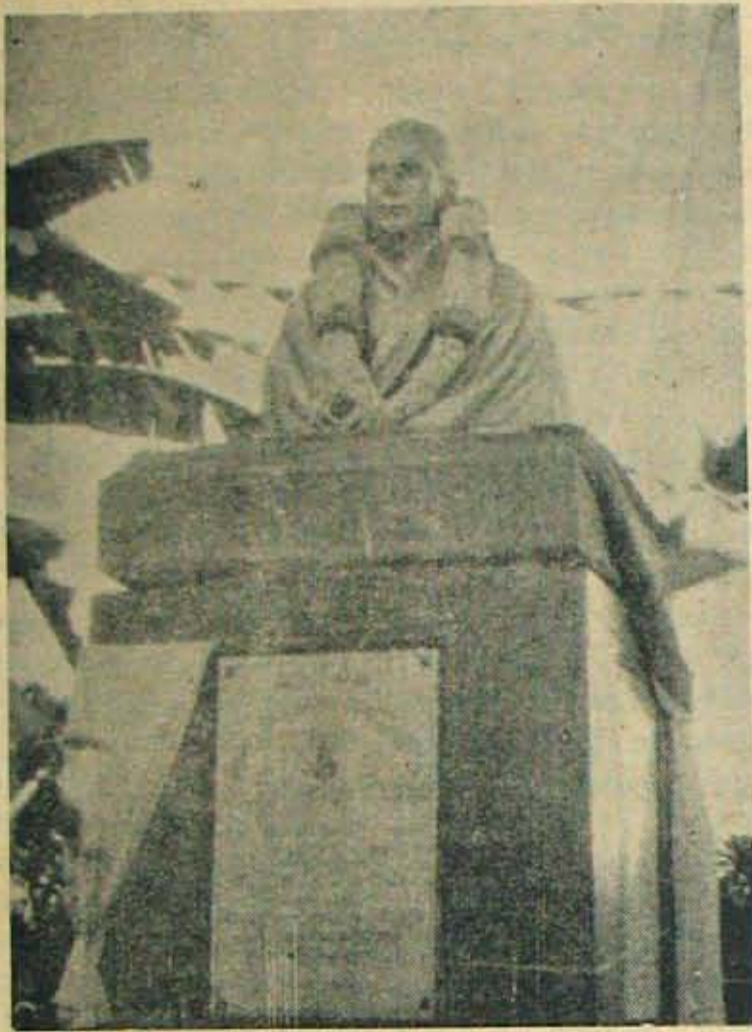
5 వ తేది భారత ఉపరాష్ట్రపతి శ్రీ వి. వి. గిరిగారిచే నెల్లూరులో ఆవిష్కరింపబడిన అమరజీవి పొట్టి శ్రీరాములు విగ్రహం

20-4-68 Saturday LEELA MAHAL NELLORE. Dr. Gold Foot & The Bikini Machine Cinemascope - Colour.