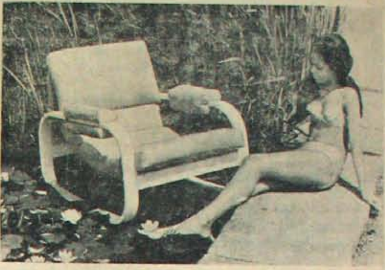
ఇది వివేకం కాదట, వివేకం వస్త్రాలట! ఇది నిరమాలోని దృశ్యంగాదట, ప్యాషన్ ప్రదర్శనకాదాదట! వల్లిమ అర్చనలోని వెయిల్ వల్లిమారా కనిపెట్టిన లోక 'వివేకం'తో చేయబడిన వర్షచర్, వుదువుల ప్రదర్శన అట. ఈ వివేకం నీటిని అంటున్నందు, చేతును చేరనివ్వదు, వివిధరకాల రంగుల్లో ఉలిస్తుంది. వివేకం చేయబడిన వర్షచర్ ను వర్షంలో విడిచినా దిగులులేదు. ఇక యీ వివేకం వస్త్రాలు ధరించి ఎన్నిగంటులు అల్లడలాడినా లేమసాకదు-ఈజలకన్య ధరి చినదుస్తులు, వక్కనన్నకర్మి రె. డా వివేకం చేయబడినవే.

ప్రతిపాదన అమెరికాదాకా వెళ్ళింది ఇటాలిన్ దానికనుకూలంగా వుంటే తప్ప అమెరికన్లు అభ్యర్థించరు. బిటో 'అరబ్బి ముషి' అనే అభిప్రాయంలో ఇటాలిన్ వున్నదిగనక అసీమ బిటో యత్నాన్ని వర్షించలేదు. అరబ్బిలు దానిని తిరస్కరించే- 'కమవాడే' సూచించిన మార్గం గనక! అందువలన, అమెరికాలో మొదట గమనింపును కాస్త నంపాదిస్తే, రష్యన్లు అతర్వాత కలిసివస్తే, అపీమ్ముల ఇటాలిన్లు, అరబ్బిలు అంగీకరించకవచ్చు.