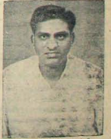
తిరుగు కాసినసభయోగం? మొవలు మొన్న అలపాటివరకు ఈ సంప్రదాయమే అనుసరించబడింది. ఇప్పుడు మాత్రం ఆ సంప్రదాయాన్ని తిన్నగా ఎందుకుండబోతుంది? అసంపాకవారుగా.

పి. సి. మరణించి వక్షంకోటలు కాలేదు; అప్పుడే రావుారు నియాజకవర్గ అభ్యర్థిత్వంపై పూహగానాలు ప్రారంభమయ్యాయి. రాజకీయాలలో ఇది అస్వభావికమూకాదు, విక్షూర మూకాదు. కెన్నడి శివప్రకాశనే, బాన్సుకా అభ్యర్థుడుగా ప్రమాణస్వీకారంచేకాడు; శాస్త్రీ భౌతికకాయం కామ్మెంటులో వుండగనే సందా కాశ్యాతిక ప్రధానిగా అధికారం స్వీకరించారు, మానవసహజమైన శోక విధారాలకు; రాజ్యాంగబద్ధమైన లాఠరాలకు సంబంధంలేదు. అందువల్ల పి. సి. మృతివల్ల భౌతికకాయం రావుారు స్థానానికి అభ్యర్థి ఎవరు అని పూహగానాలు జరగడం అనుచితమేమీకాదేమో!