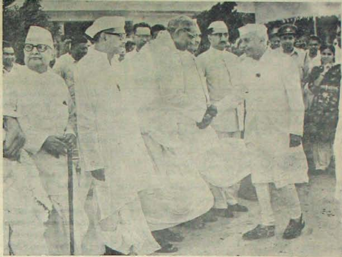
స్వర్ణీయ ప్రధాని నెహ్రూతో కరదాలనంచేస్తున్న స్వర్ణీయ వి. సి.

సంతాప తీర్ధాసంతో, ఆత్మకాంతికై మోస ప్రార్థనతో దాదాపు నాలుగు గంటలసేపు జరిగిన సంతాపనతో పరిసమాప్తమైంది. —మా. ది.