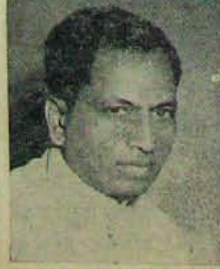
విదానాల్లో ఉత్తర దక్షిణ ధ్వజాలు!