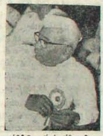
పరిస్థితి అదుపు తప్పింది— శ్రమ తప్పదు!