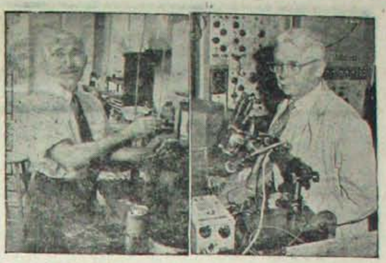
వైద్యంలో 1967 నోబల్ బహుమతి పొందిన ముగ్గురిలో ఇరువురు అమెరికన్లు- డాక్టర్ చార్లెస్ ఆవర్ హార్టిన్ (83), మ్యూయార్కులోని డాక్ టెల్లర్ విశ్వ విద్యాలయంలో బయోఫిజిక్సు ప్రొఫెసరు; రెండవవారు- డాక్టరు జార్జి వార్డ్ (80) హార్వర్డు యూనివర్సిటీలో బయో-జీ అధ్యాపకుడు; మూడవవారు స్వీడన్ దేశీయుడు డాక్టరు రానార్ గ్రాన్ బ్. కంటిమాపుకు నొబల్ బహుమతి పొందిన వారిలో తనలో వీరు నోబల్ బహుమతి అర్హులయ్యారు

తాను వెలితి అయిపోతాడు కాబోలు! తన ప్రభుత్వ పారిశ్రామిక విధానం మీద తన పార్టీ గాందిన దిమర్చి అందరికీ వర్ధిల్లుంది- ప్రభుత్వంలోని అందరికీ వర్ధిల్లుంది. ఇతే తానెందుకు ప్రభుత్వార్థి పీఠం? పీఠక, సాటిమంతులను బోధగా లేక దిలరగా ఎవరైనా కొనుగోలు చేయవచ్చునన్నాడు. ఇంతకుపూర్వం తానే వీరిని కొన్నాడా? తననెవరు కొన్నాడు? ఈ ప్రశ్నలర్థికి వమాధానం ఇవ్వగల కర్కశక్తి ఎక్కడున్నది? లేనేలేదు. ఈ లక్షమక ఎందువలన కలిగింది? వ్యక్తిగతంగా కేరళ ముఖ్యమంత్రి మహామేధావి, నమర్దుడు, సరనుడు, విద్యాంసుడు. కాని, తన న హా జన్యతా వానికీ దిరుద్దమైన ఒక వక్షంలోవడి, దానికి వైది అపోయినాడు! అవలుకులు పలకడా పార్టీ తన్ను బహిష్కరిస్తుంది. వలుకుతాదా సాటి మంతులకు-యితర పార్టీలవారికీ-కంటక మవుతుంది. మునుపు విమోచనోద్యమం ఈయనకు 'ముక్తి'ని ప్రసాదించినప్పుడు, ఆ వర్ధిల్లిన దినరీతమైన అవిప్రాయభేదం దేశంలో