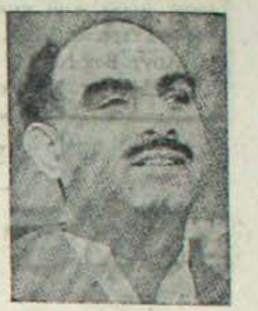
మంత్రిత్వాల లంకం తో దిన గండాన్ని దాటుకుంటూ అధి కార దినాలు దగ్గర పడ్డ హరియానా ముఖ్యమంత్రి శ్రీ రావు వీరేంద్రసింగ్

కాళీర్ మాజీ ప్రధాని బక్కి గులాం మహమ్మద్ మీద కోర్టులో రుజువైన అవి సీతి అలోచనలపై ఎలాంటిచర్య తీసుకో కుండుటకు నిర్ణయించబడినట్లు వార్త. అతను కాళీరుకు చేరిన సేవలచ్చిష్టా అమాతం బందార్యం యావడం నమందిత