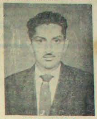
అమెరికా వెళ్లిన కందుకూరియ్యుడు

కరలకుండా బ్రతికే బ్రతుకుగదా మనది. ఇందుకు వూర్తి తిన్నంగావుంది యీ 'వాకరయాకాన్స్ ఎక్స్ ప్రెస్'. ప్రధానంగా పొక్క అడపాత్రకూడా దర్శనమియ్యదు దిశ్రంలో. ఒకటిక అడపాత్ర కనవడినా కామం ప్రకోపించలేదు. అంతా యుద్ధ వాతావరణం. వైదీయగాదిట్టుబడ్డ సైంకుం సాహసోపేత పోరాటాలు, వాళ్ల మహా